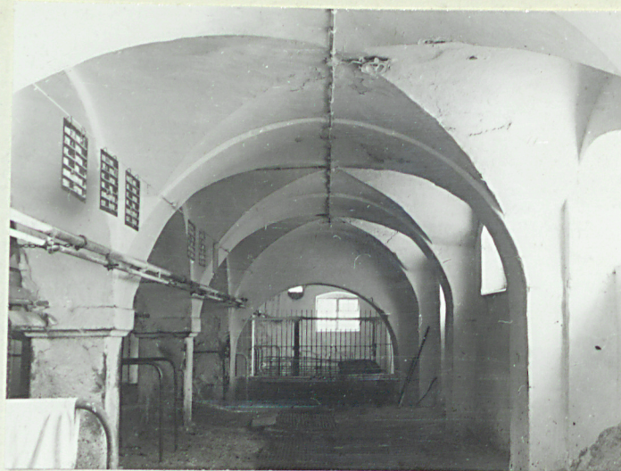
Wnętrze skrzydła wsch.