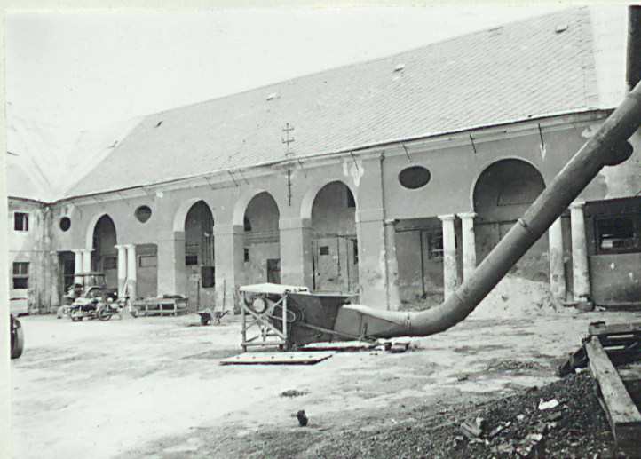
El. zach. skrzydła wsch.