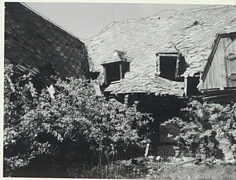
Zach. część elew. pd. wraz z frag. skrzydła zach.