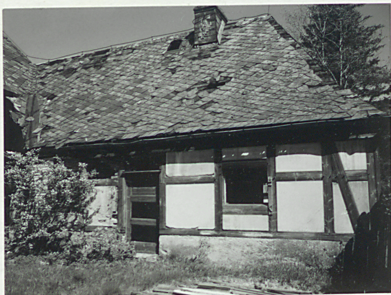
Elewacja zach. skrzydła wsch.