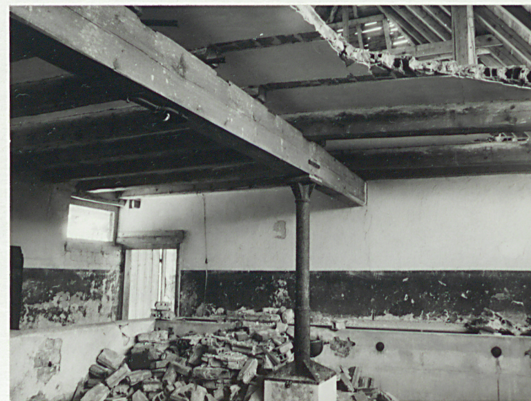
Wnętrze stajni z poidłem i kolumną podtrzymującą strop.

Wkładkę założył: Ewa Sawińska 20.05.1992