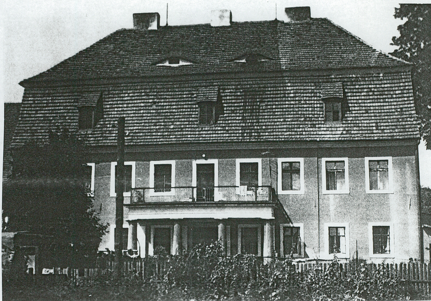
2. Elewacja frontowa pałacu.