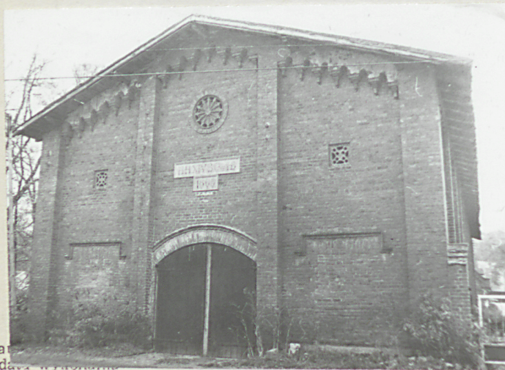
at dane wykonania miejsce przechowywania negatywów