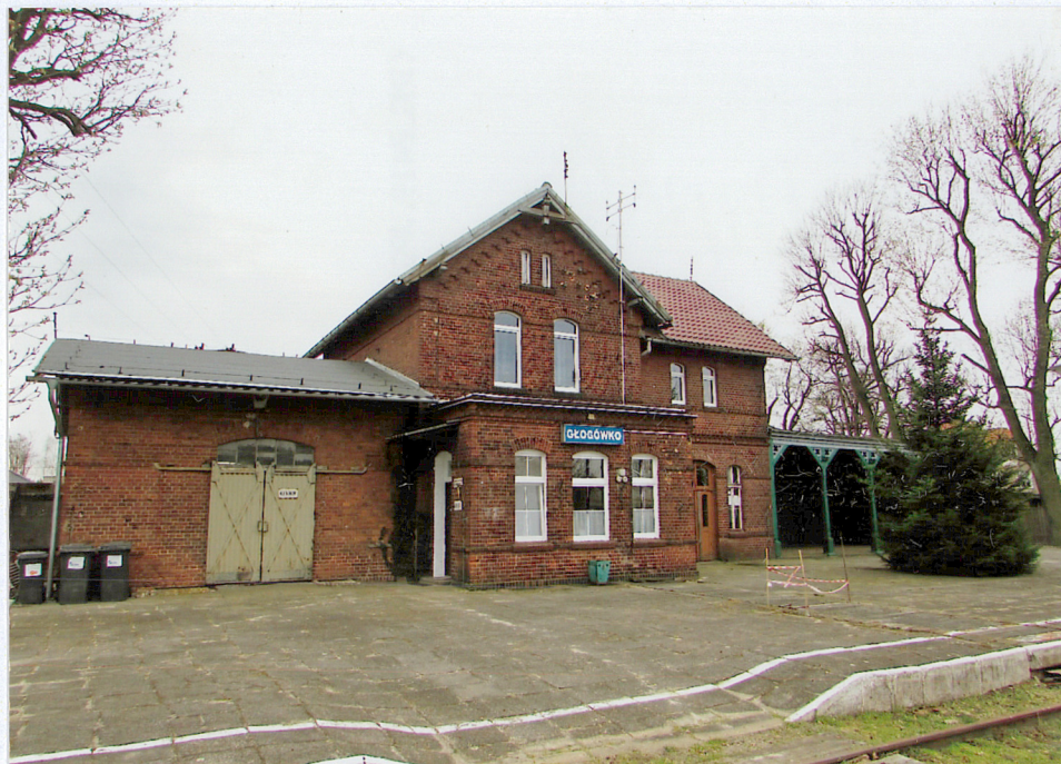
widok od strony północnej