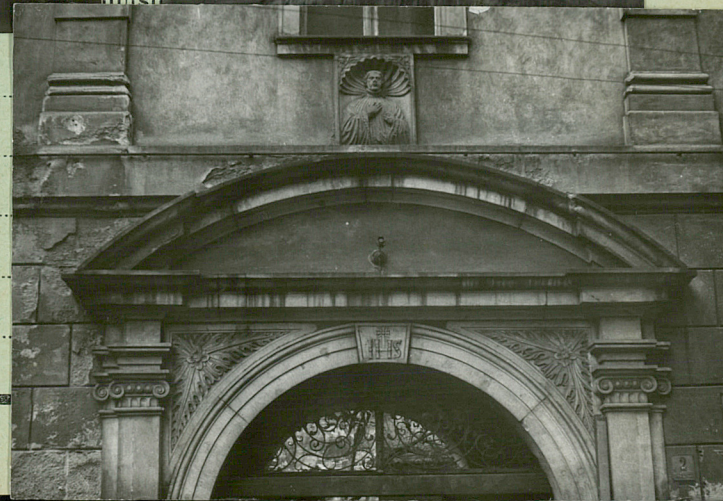
35. Uwagi różne