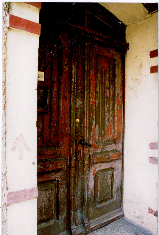
8. Drzwi główne w budynku nr 2.

5. Zawartość wkładki (nazwa materiału uzupełniającego) zdjęcia