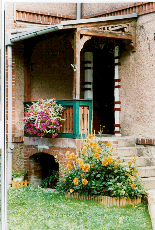
7. Ganek wejściowy, budynek nr 1.