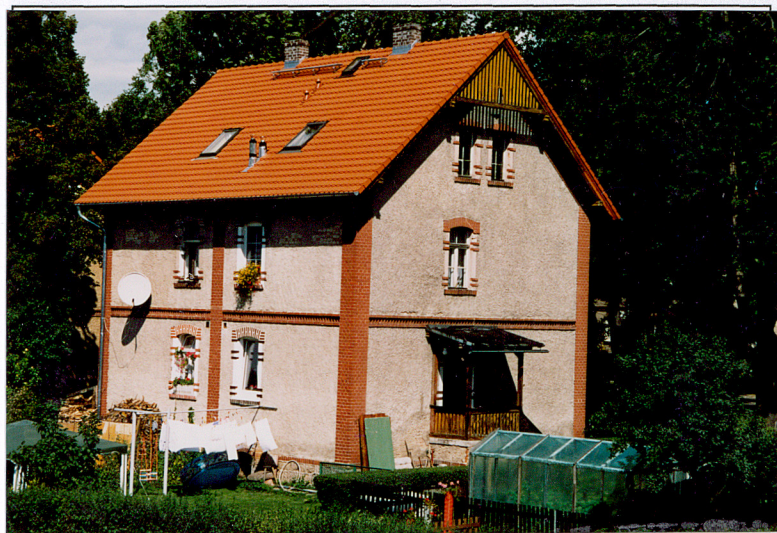
13. Budynek nr 6, widok od pd.-wsch.