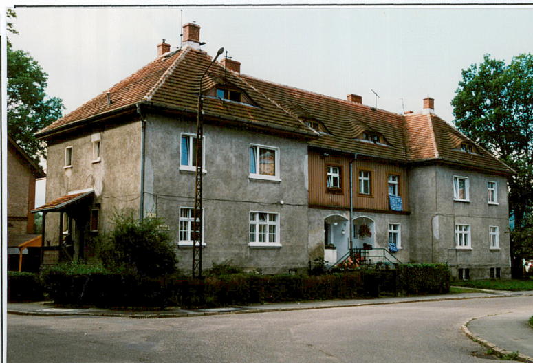
19. Budynek nr 9, widok od pn.-wsch.