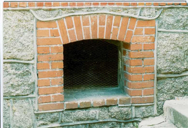
6. Okno piwniczne w budynku nr 1.