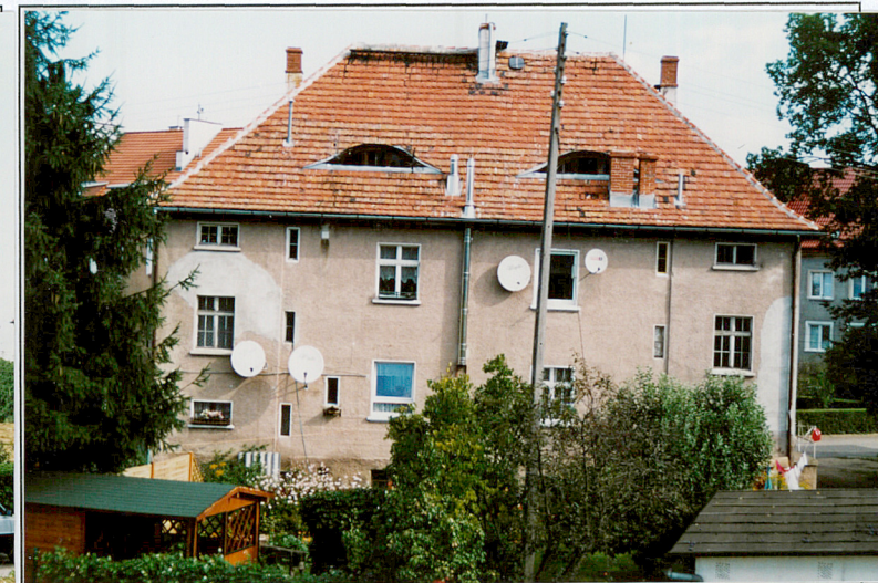
22. Budynek nr 10, widok od pd.

Wkładkę założył: Wojciech Ulanecki, 2004 r.