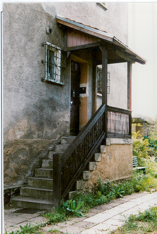
18. Ganek wejściowy, budynek nr 9

5. Zawartość wkładki (nazwa materiału uzupełniającego) zdjęcia