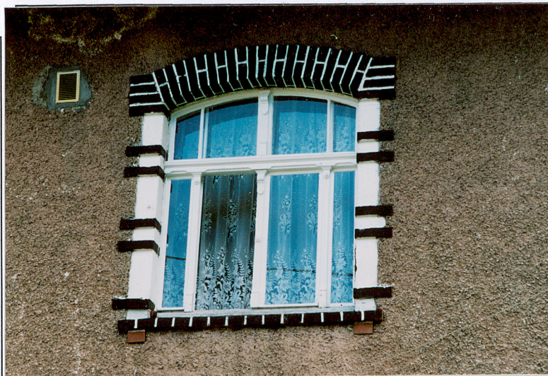
9. Okno 2. kondygnacji, budynek nr 1.