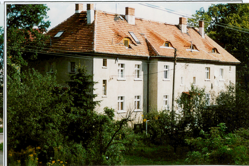
20. Budynek nr 9, widok od pd.-zach.