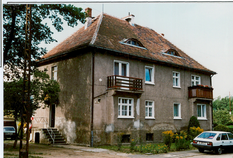
21. Budynek nr 10, widok od pn.-wsch.