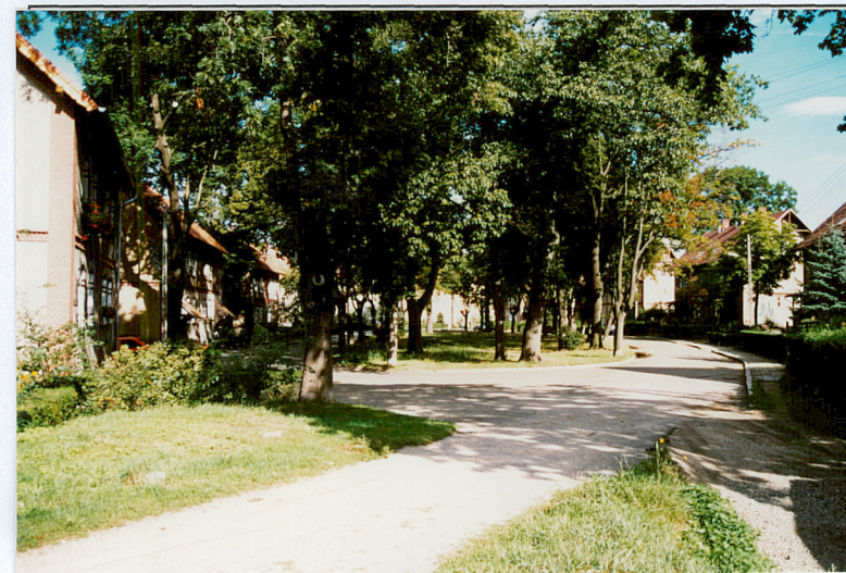
2. Widok ronda na osiedlu od strony pd.-wsch.

Wkładkę założył: Wojciech Ulanecki, 2004 r.