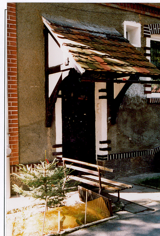
16. Wejście do budynku nr 7