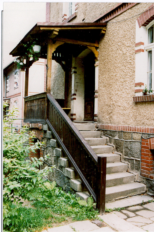
15. Ganek wejściowy w budynku nr 2.