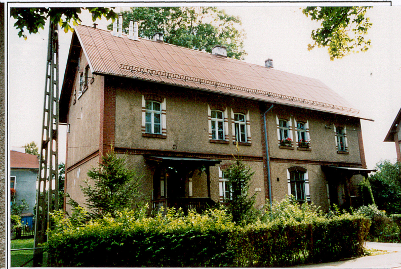
10. Budynek nr 2, widok od pd.-zach.