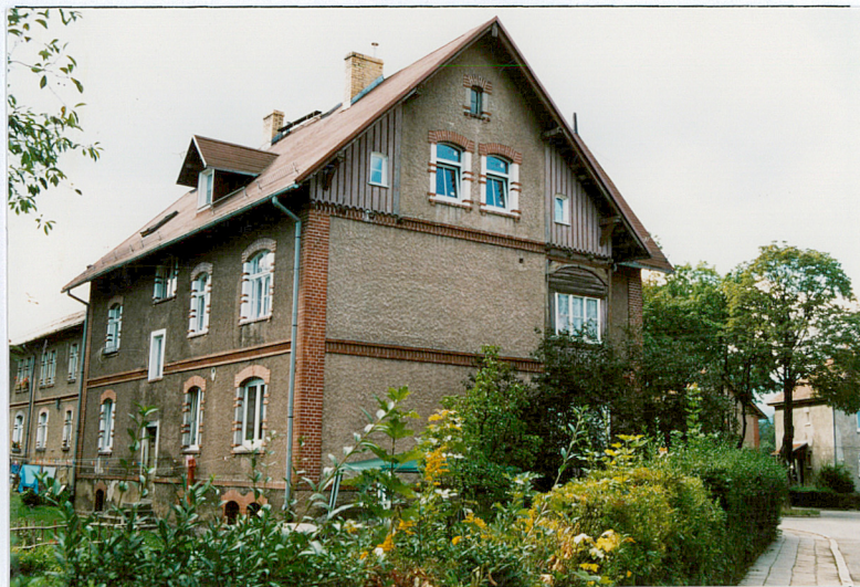
4. Budynek nr 1, widok od pn.-zach.