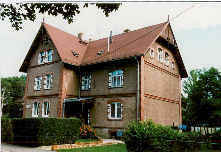
5. Budynek nr 1, widok od pd.-wsch.