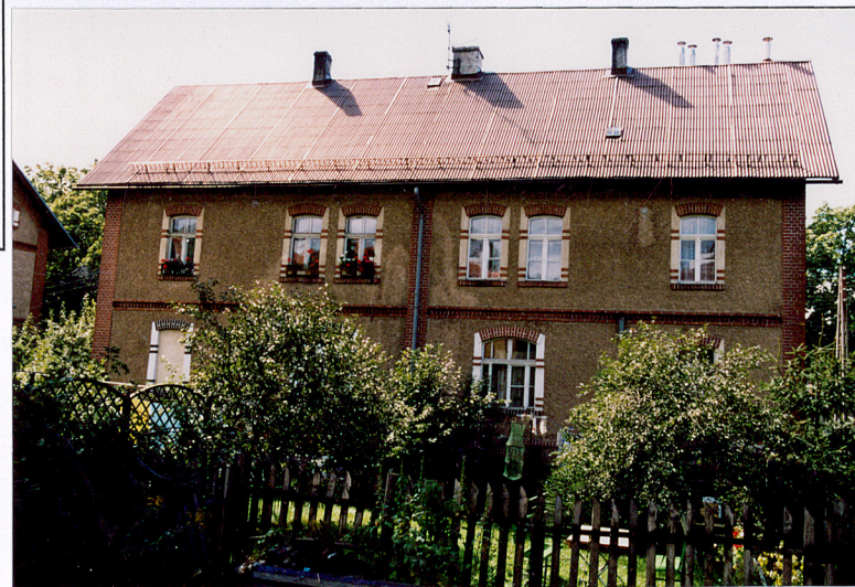
11. Budynek nr 2, widok od pn.-wsch.