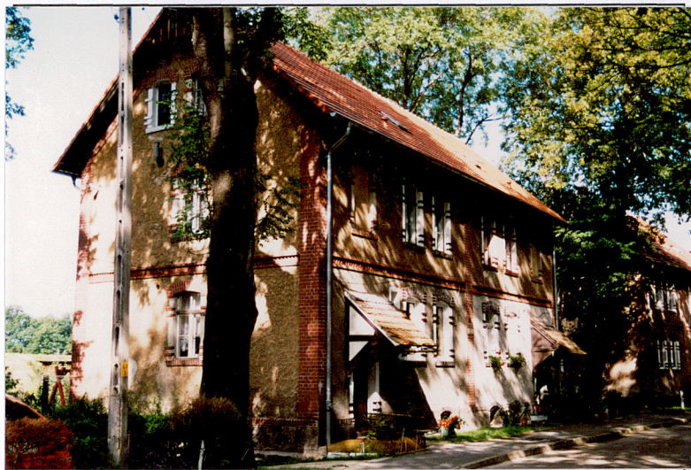
14. Budynek nr 7, widok od pn.-wsch.