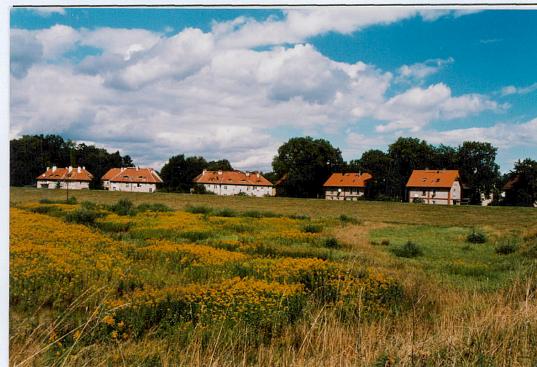
1. Widok na osiedle od strony pd.