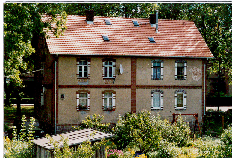
17. Budynek nr 7, widok od pd.