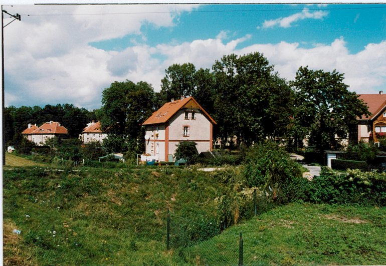
3. Widok na osiedle od strony pd.-wsch.