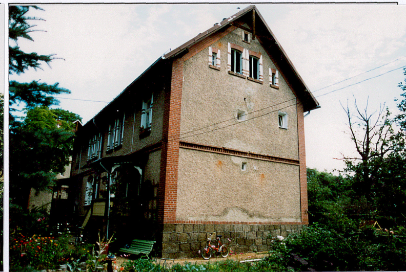
12. Budynek nr 2, widok od pd.-wsch.

Wkładkę założył: Wojciech Ulanecki, 2004 r.