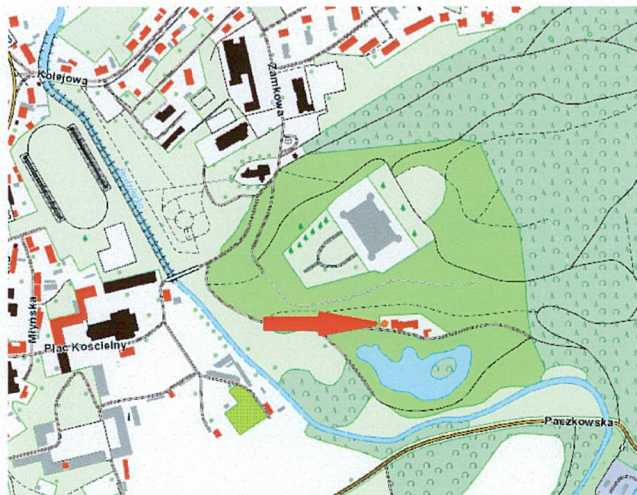
Plan orientacyjny 1:5000