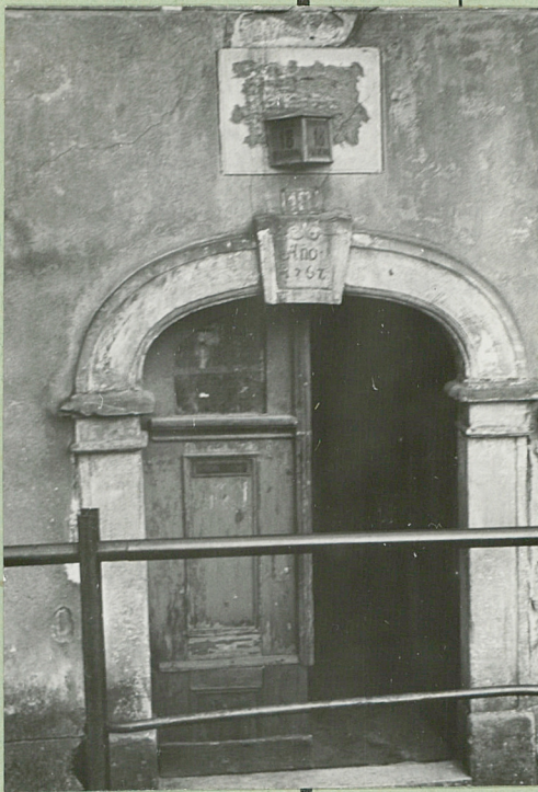
32. Przebieg prac konserwatorskich