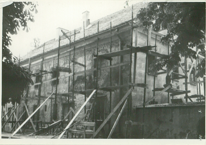
32. Przebieg prac konserwatorskich