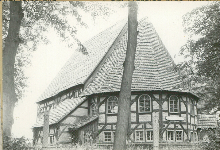
32. Przebieg prac konserwatorskich