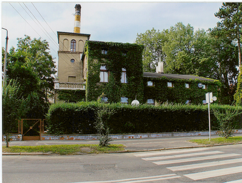
Widok od strony pld.