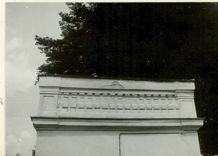
fot. 6 attyka ze ślepią balustradą