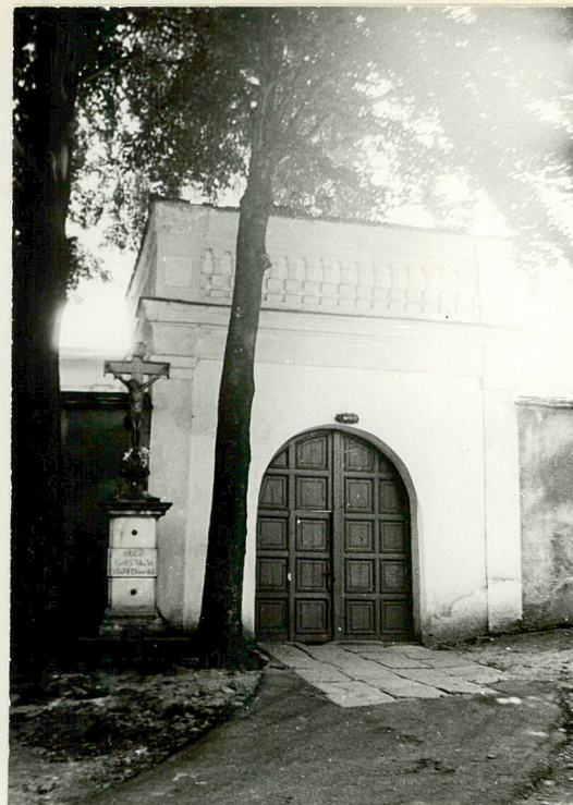
fot. 3 elewacja zewnętrzna (północna)