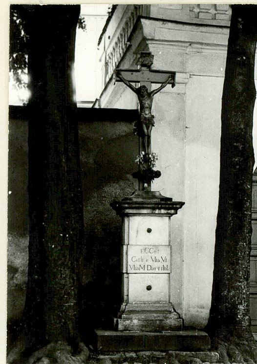
fot. 4 krzyż przed bramą