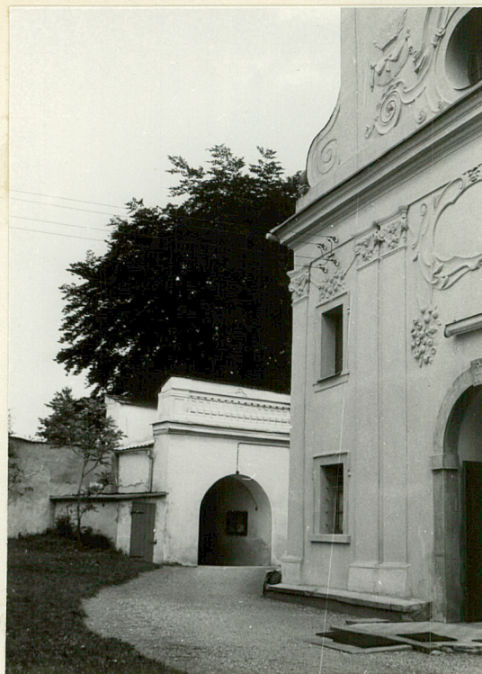
fot. 2 widok od strony płd., z fragmentem fasady kościoła