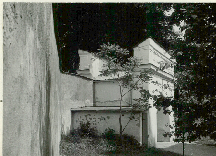
fot. 5 widok od płd.-zach, widoczna przybudówka

jed. W.A. Olsztyn z. 135/S OZGraf. Z.P. Ostróda z. 676 n. 40 000