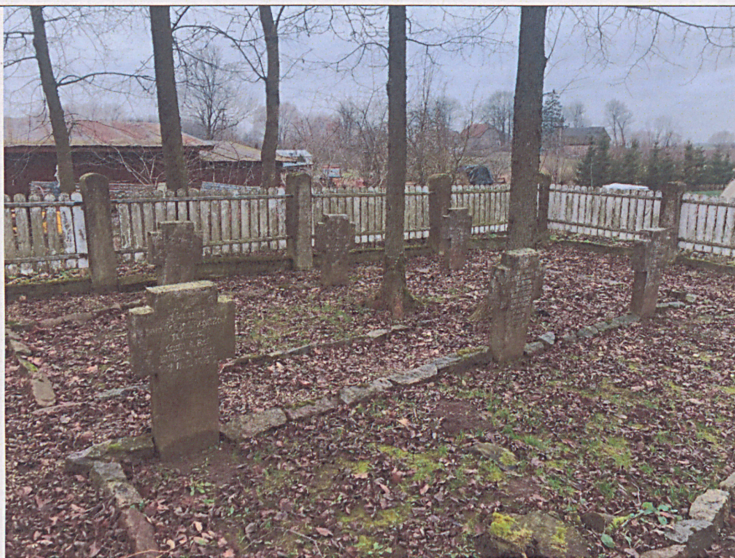
Stan nagrobków przed rozpoczęciem prac renowacyjnych