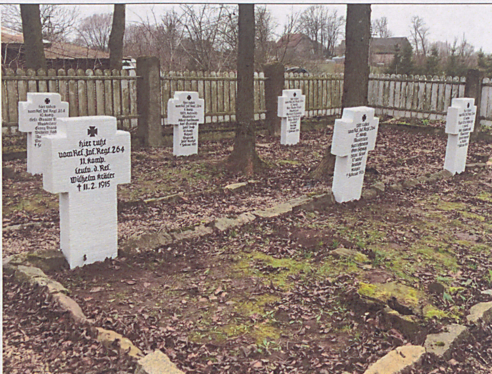
Stan nagrobków po pracach renowacyjnych