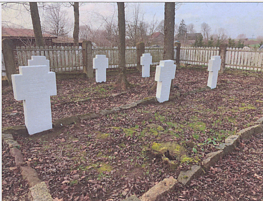
Nagrobek nr 6: stan przed renowacją (a) i po renowacji (b)