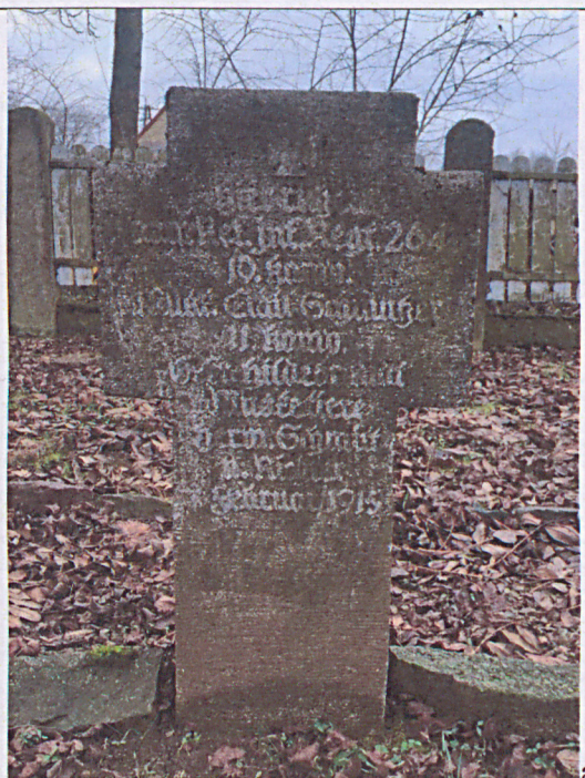
Nagrobek nr 2: stan przed renowacją (a) i po renowacji (b)