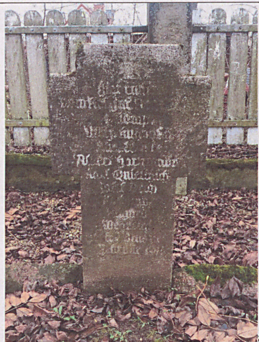
Nagrobek nr 4: stan przed renowacją (a) i po renowacji (b)