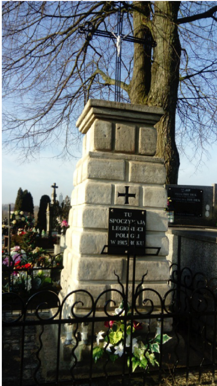
Pomnik Legionistów – Bogoria