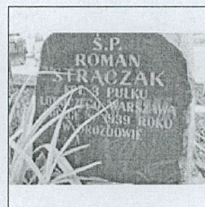
Zbliżenie na tablicę na grobie. Przeinaczeniu uległ stopień poległego (kapitan zamiast kapral), nazwisko ("Strączak"), jednostka (3 pułk zamiast 6 pułku) oraz miejsce stacjonowania pułku (Warszawa zamiast Lwowa).