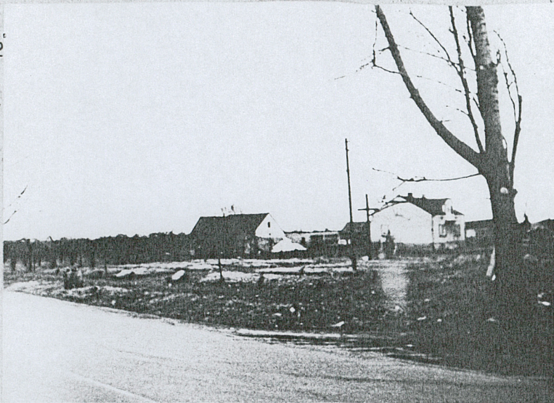
1. Cmentarz od strony drogi