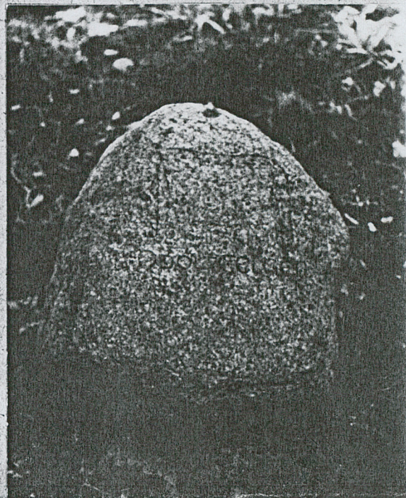
4. Nagrobek kamienny z napisem ADOLF FELGER - Pionier poległ 6.7.1915r