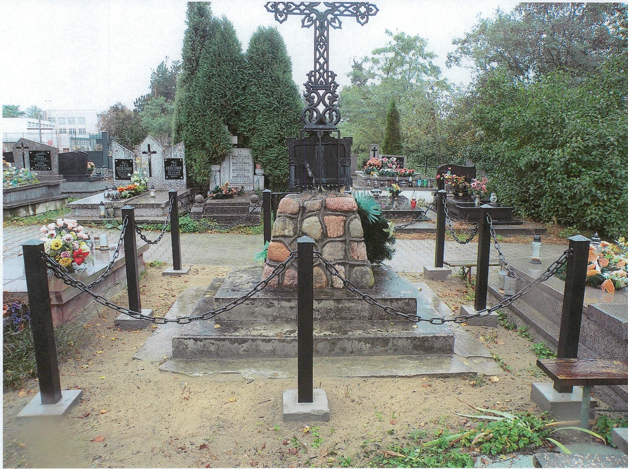
Licht pool vervuilen