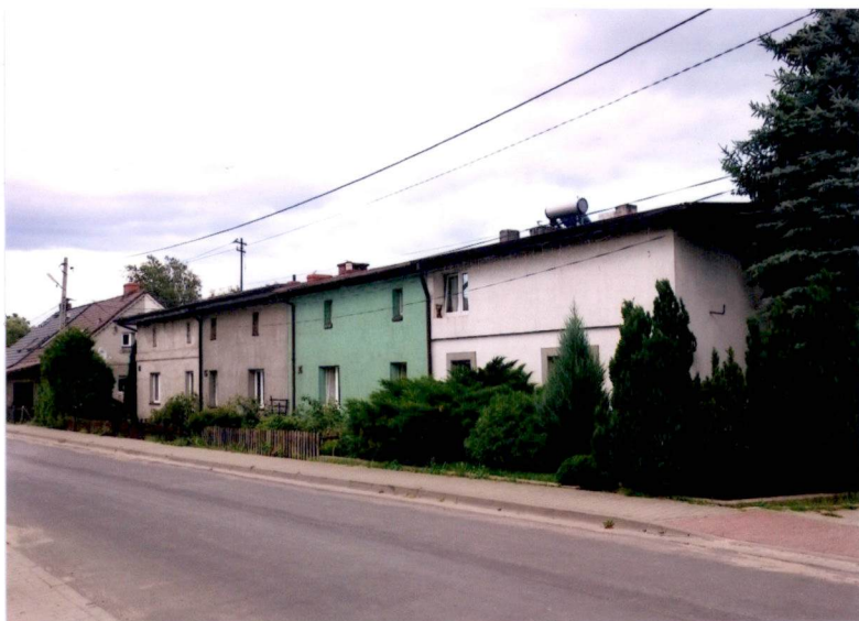
Widok na elewację zachodnią i południową