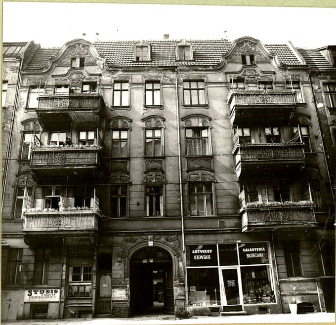
32. Przebieg prac konserwatorskich