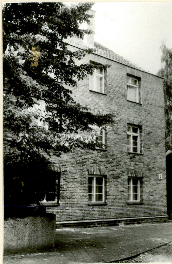
Widok elewacji półn.-wsch.

plan sytuacyjny, rzut przyziemia, fotografie