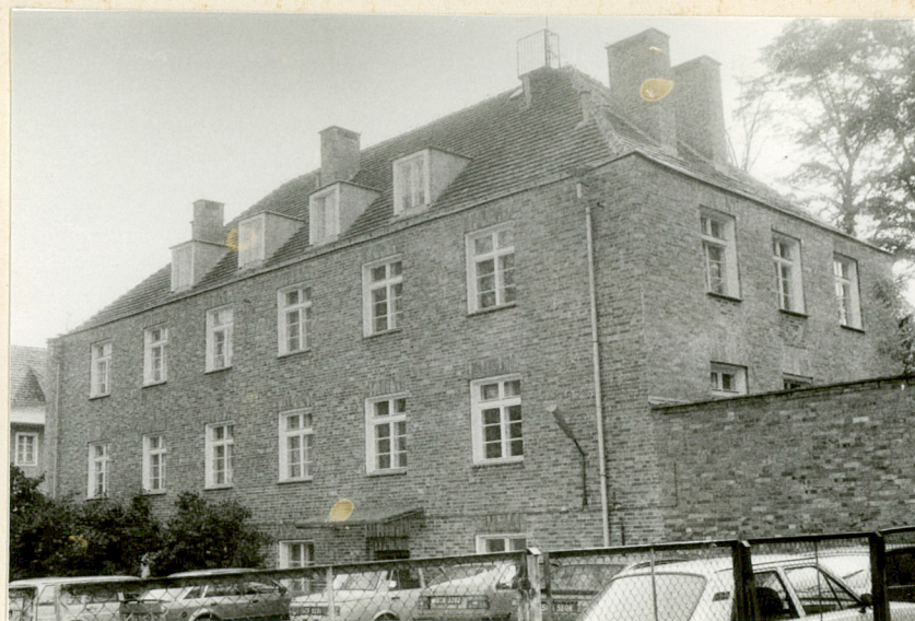
Widok elewacji tylnej półn.-zach.