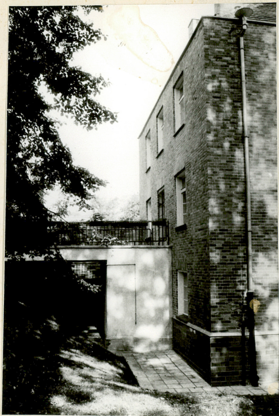
Widok elewacji połudn.-zach.