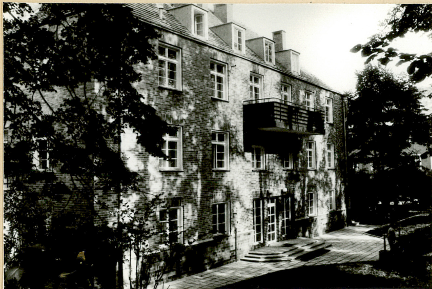
Widok elewacji frontowej połudn.-wsch.