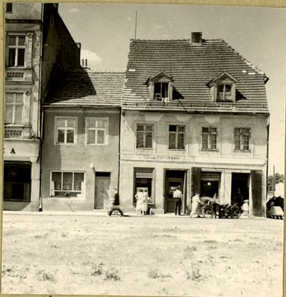
Nr 23. Nr 24

Budynek murowany, tynkowany, usytuowany kalenicowo, dwuosiowy, dwukondygnacyjny. Parter przebudowany na sklep, dach dwuspadowy kryty dachówką.