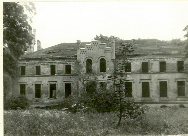
10 fol. 8