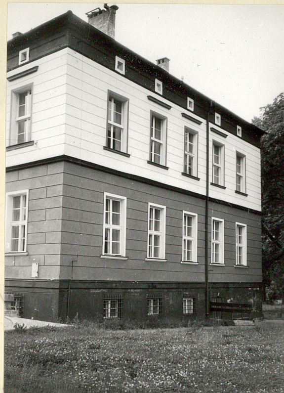
elewacja boczna wsch.