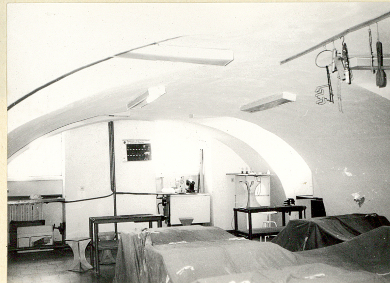
wnętrze - kolebkowe sklepienie piwnic