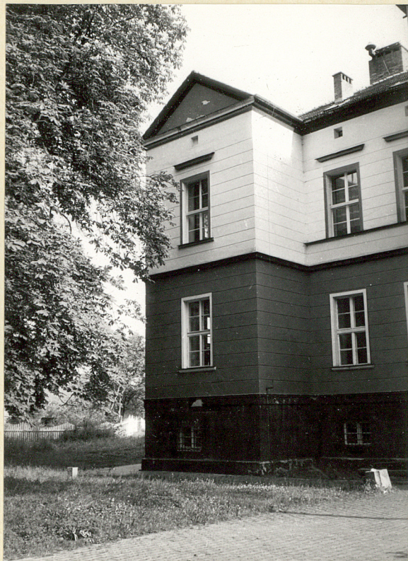
fragm. elewacji ogrodowej boczny ryzalit wsch.