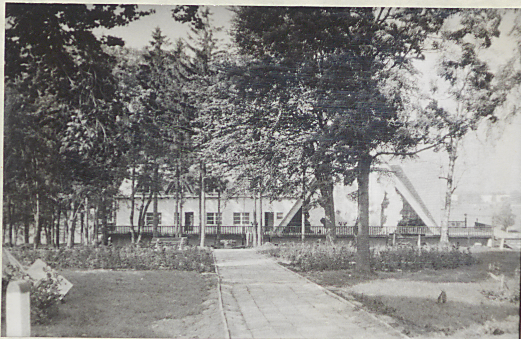
NR 1. BUDZISTOWO - Park

Widok na grupę drzew wokół budującego się zajazdu