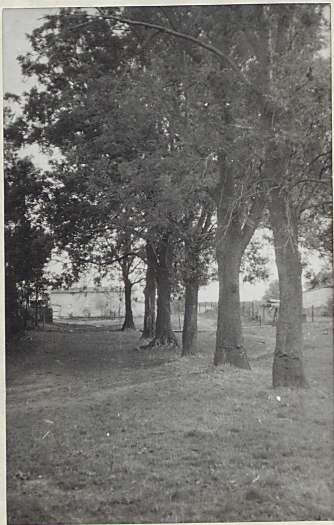
NR 3. BUDZISTOWO - Park Aleja jesionowa