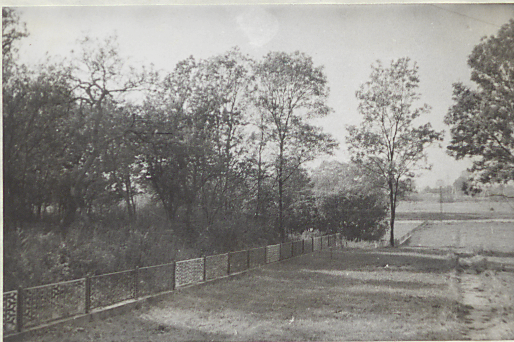
NR 2. BUDZISTOWO - Park

Widok na grupę drzew wokół budującego się zajazdu