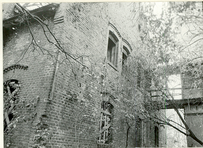
6 i 7. Fragmenty elewacji szczytowej pld.-wsch. /od pałacu/ z pomostem przejściowym. Widok od wsch. i zach.