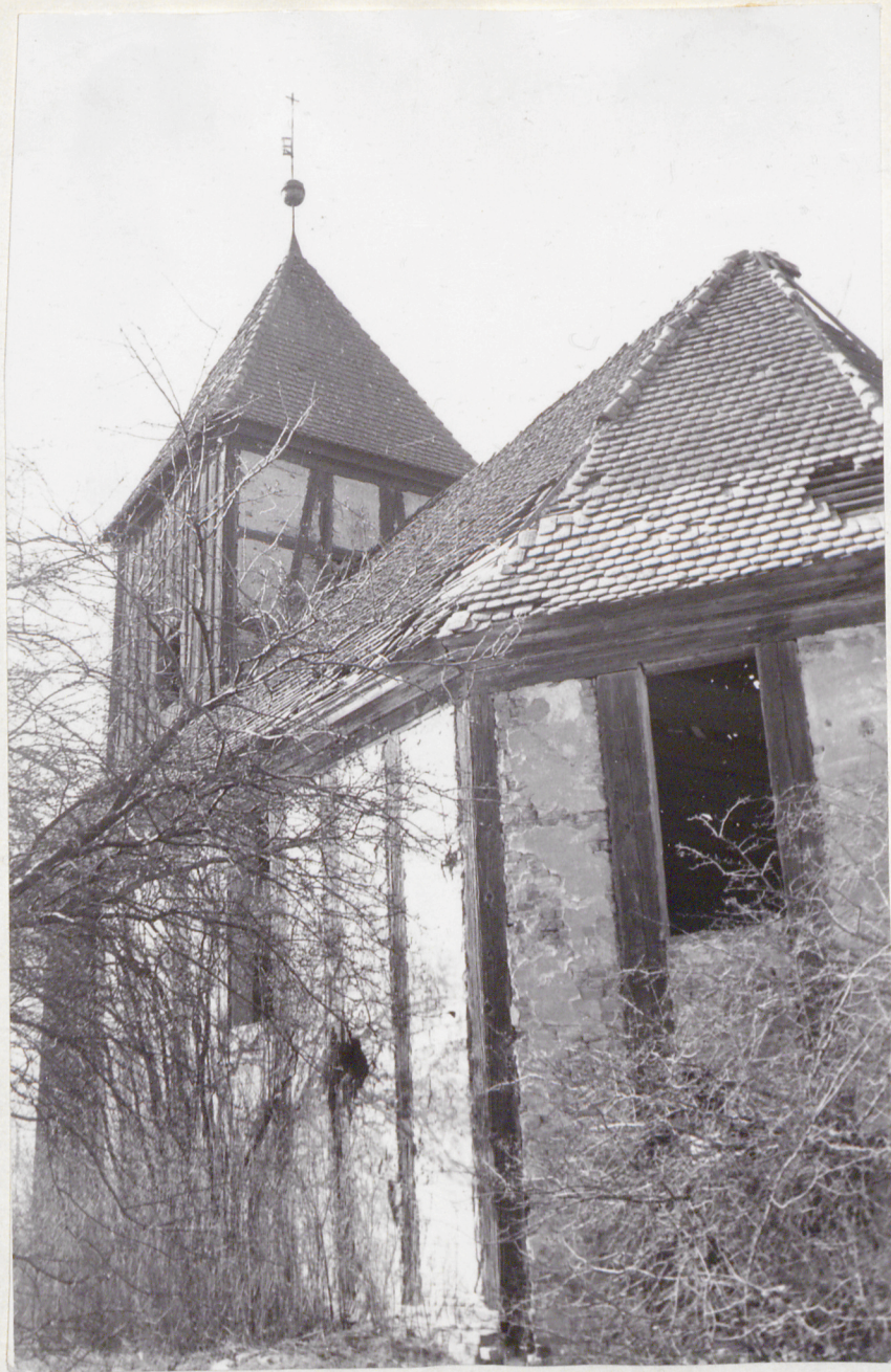
fol. S. Kwilecki kwiecień 1872