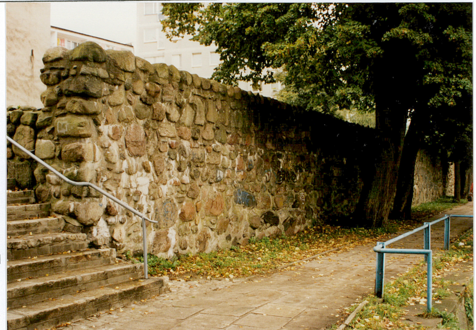
Fot. nr 31