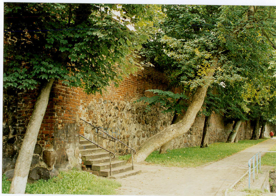
Fot. nr 28