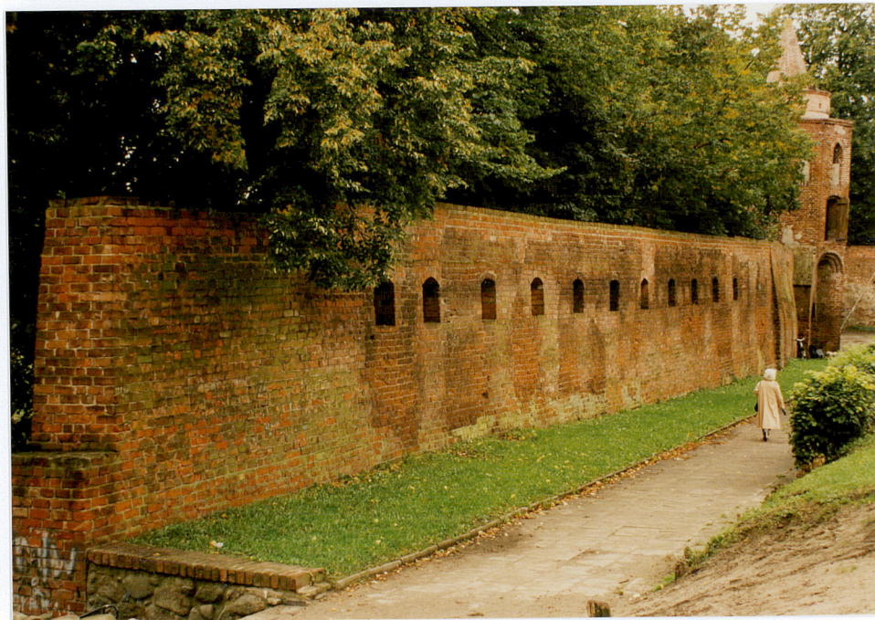
Fot. nr 30

3. Zawartość wkładki (nazwa obiektu lub materiału uzupełniającego) fotografie