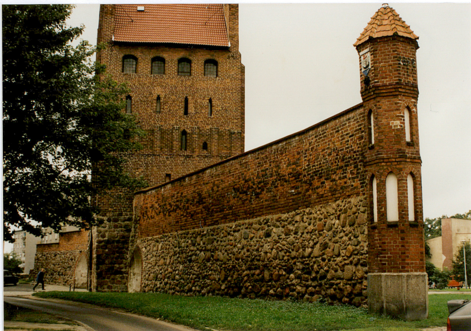
Fot. nr 15

3. Zawartość wkładki (nazwa obiektu lub materiału uzupełniającego) fotografie