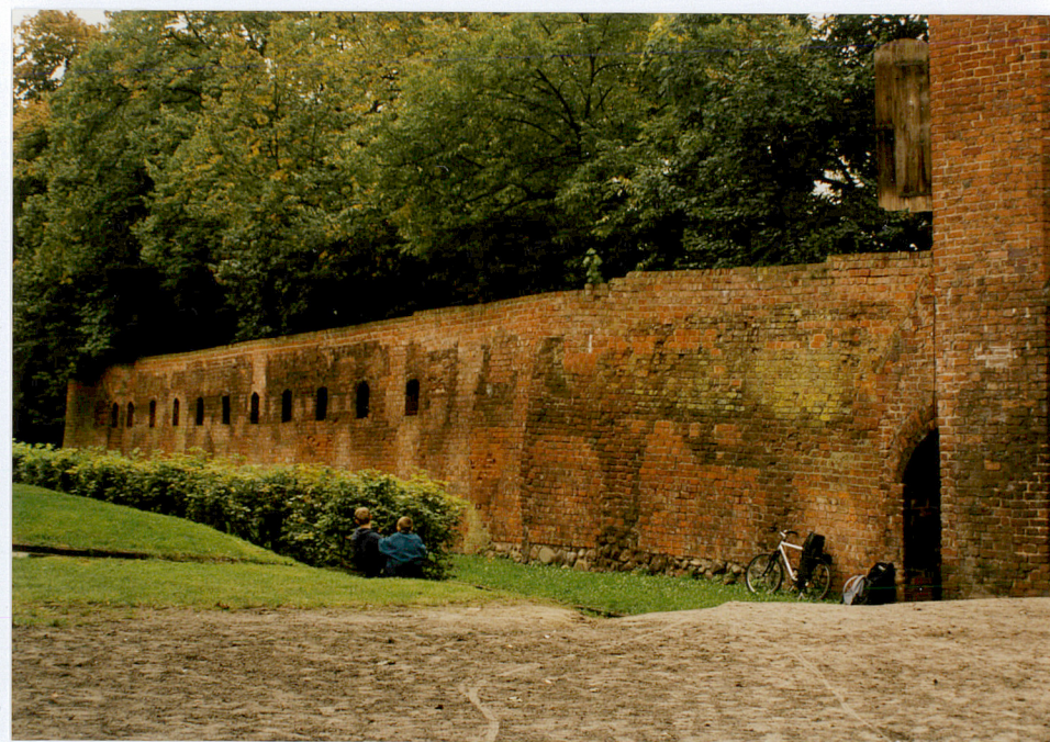
Fot. nr 29