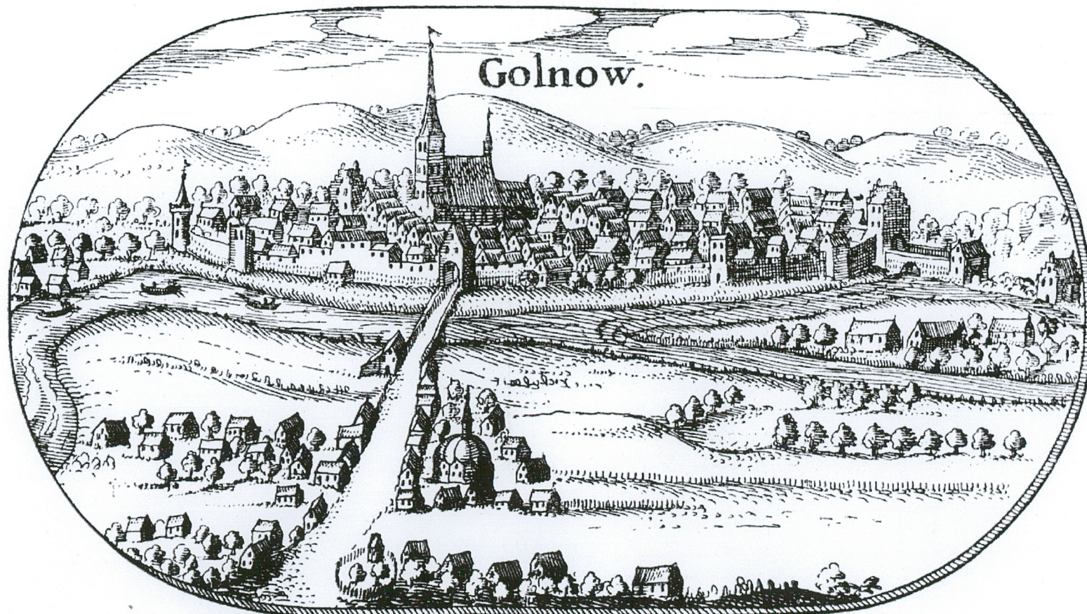
Panorama miasta wg Lubinusa z 1617 r.