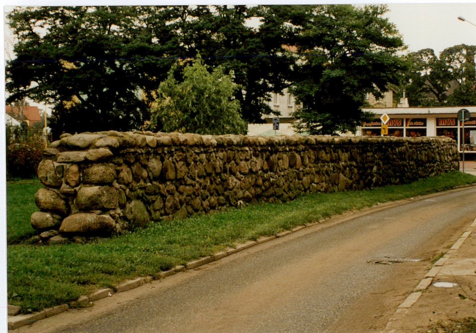
Fot. nr 14