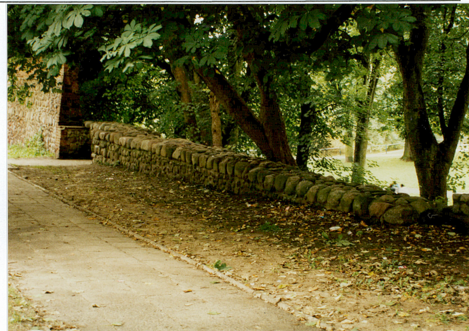
Fot. nr 23