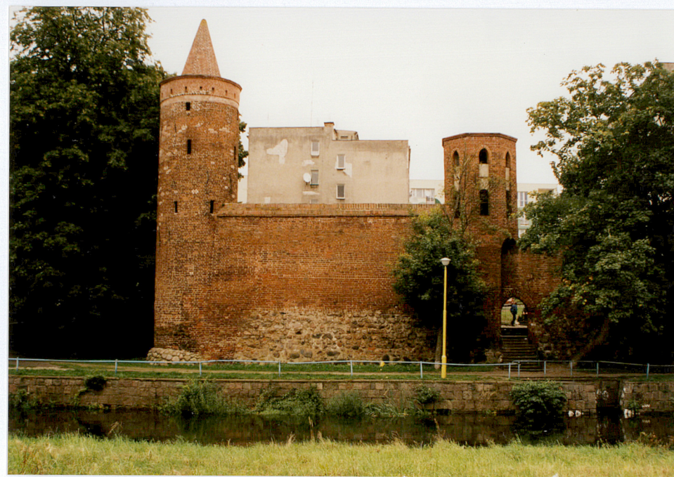
Fot. nr 26