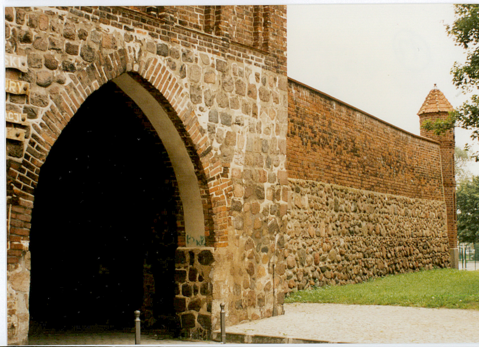
Fot. nr 17

Wkładkę założył: mgr Elwira Wolender, wrzesień 2001 r. Miejsce przechowywania negatywów: WOSOZ Szczecin