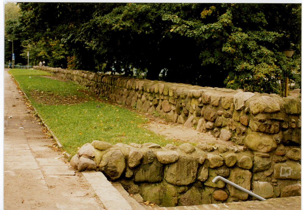
Fot. nr 32

Wkładkę założył: mgr Elwira Wolender, wrzesień 2001 r. Miejsce przechowywania negatywów: WOSZ Szczecin