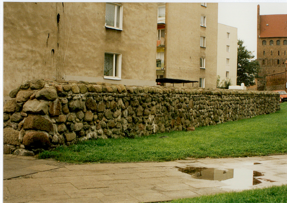
Fot. nr 12