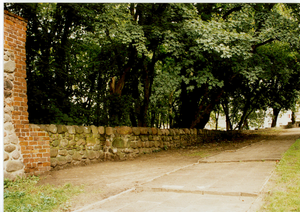
Fot. nr 24

Wkładkę założył: mgr Elwira Wolender, wrzesień 2001 r.