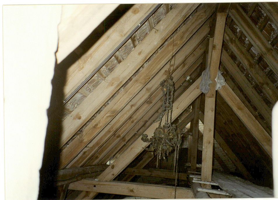
Fragment więźby dachowej