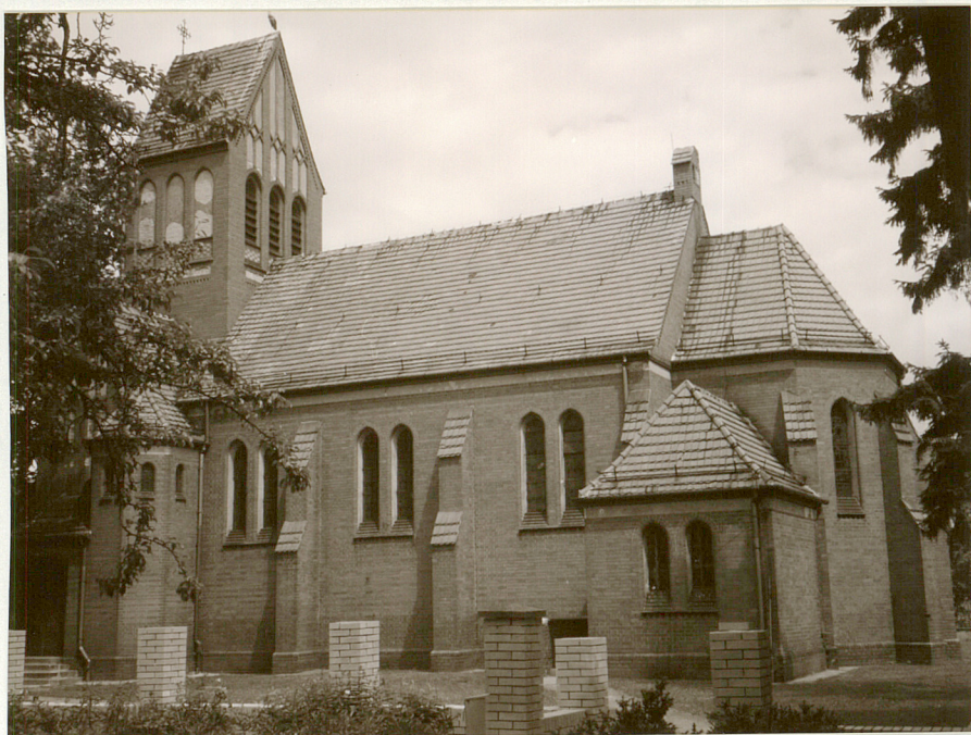
Elewacja południowo zachodnia