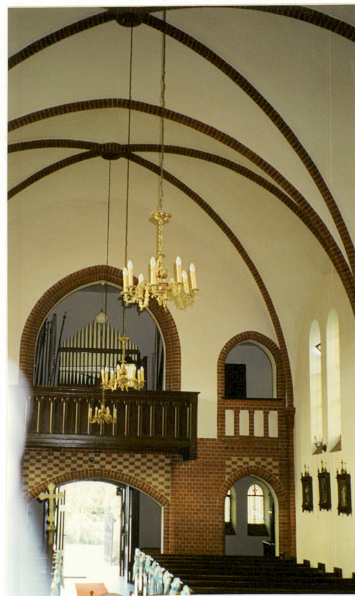
Widok na płn. Zach. Ścianę nawy korpusu