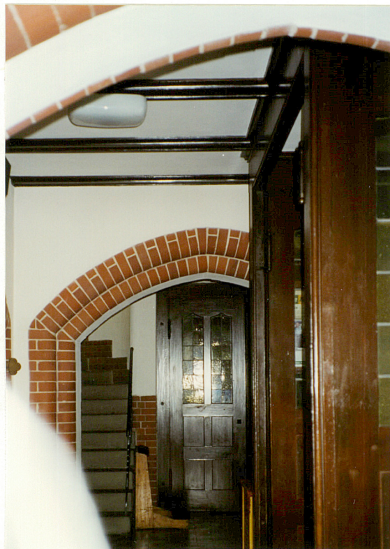
Wnętrze kruchty podwieżowej