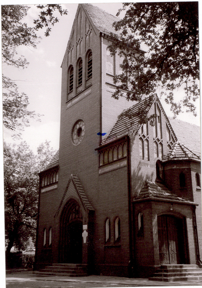
Fasada północno zachodnia

11. Zdjęcia, rzut, przekrój, sytuacja, orientacja