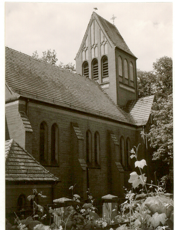
Elewacja północno wschodnia