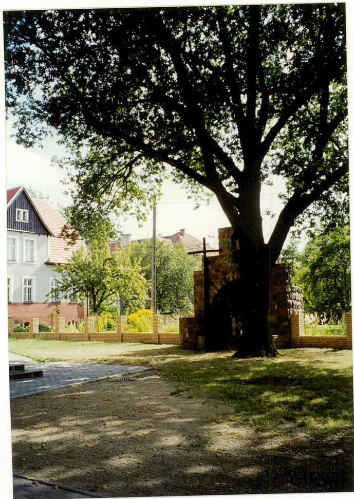
Kapliczka przy południowo zach. Granicy działki