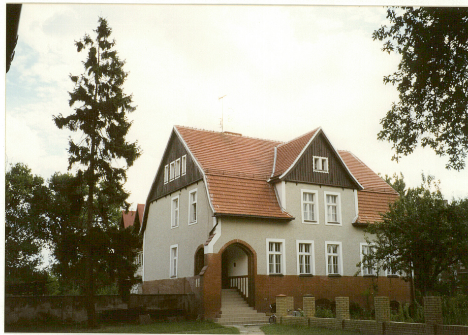
Widok na plebanię.