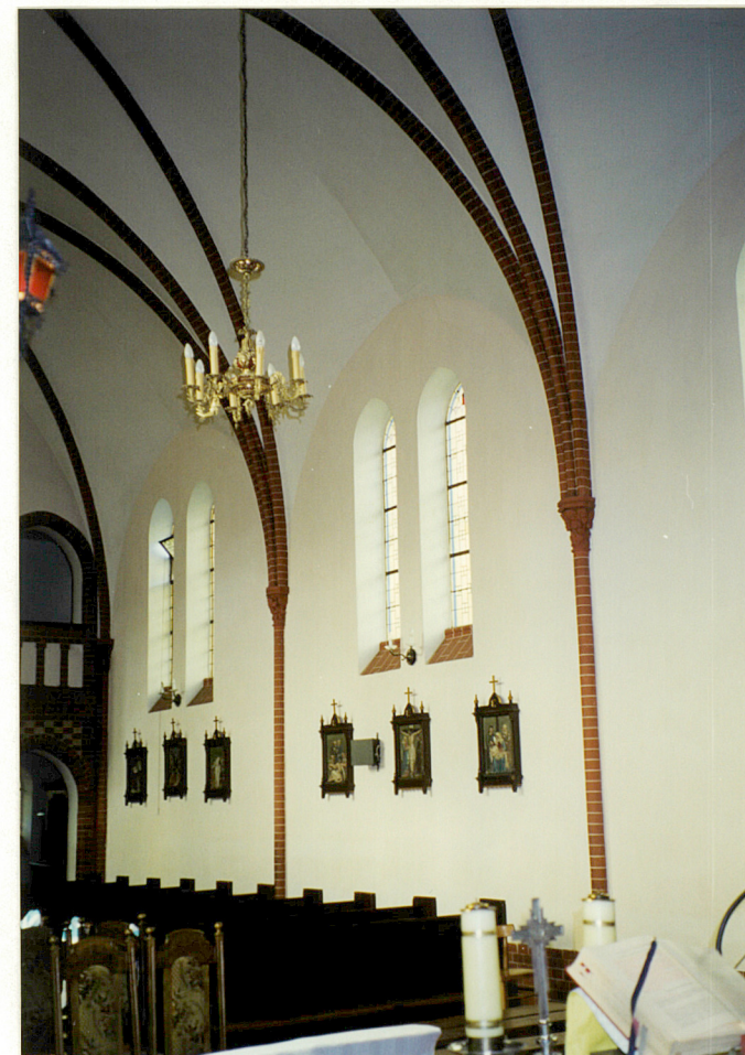
Widok na płn. Wsch. ścianę nawy korpusu