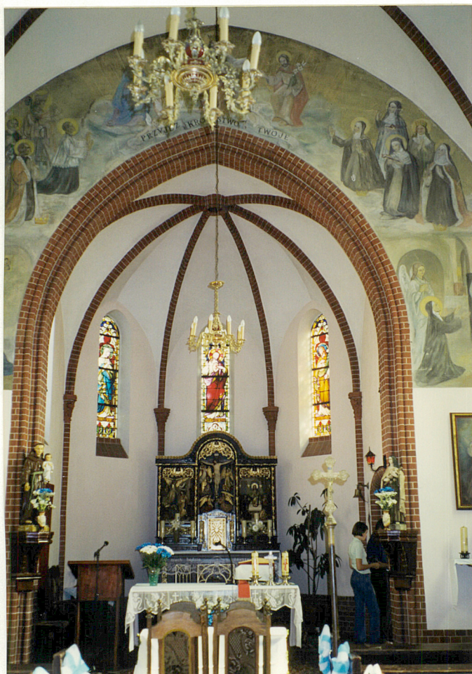
Widok na prezbiterium