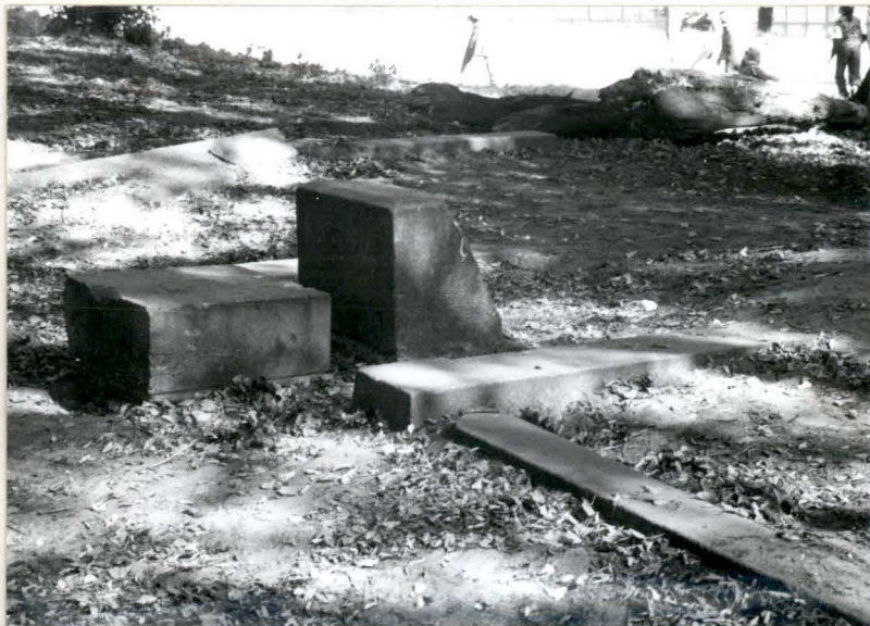
Barlinek, cm. żydowski 1. Zadrzewienie 2. Aleja lipowa 3. Pozostałości – obramowanie mogił