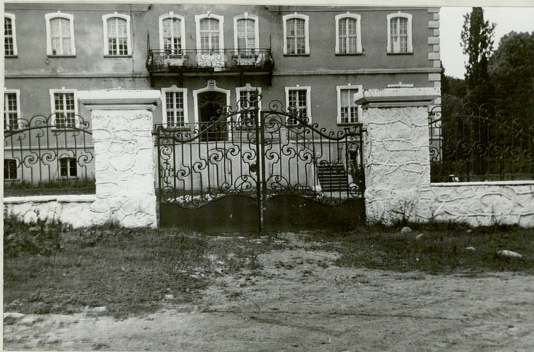
NR 2. WIELIN - Park Brama wjazdowa, ogrodzenia od strony frontu pałacu