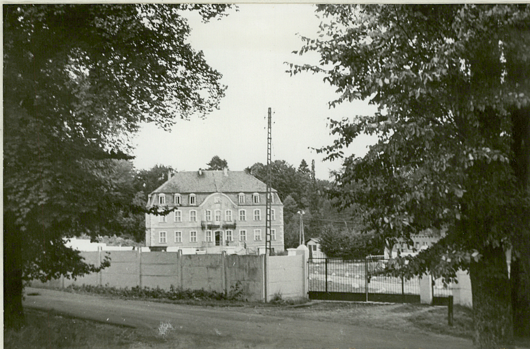
NR 1. WIELIN - Park Pałac, w głębi sadzawienia parku