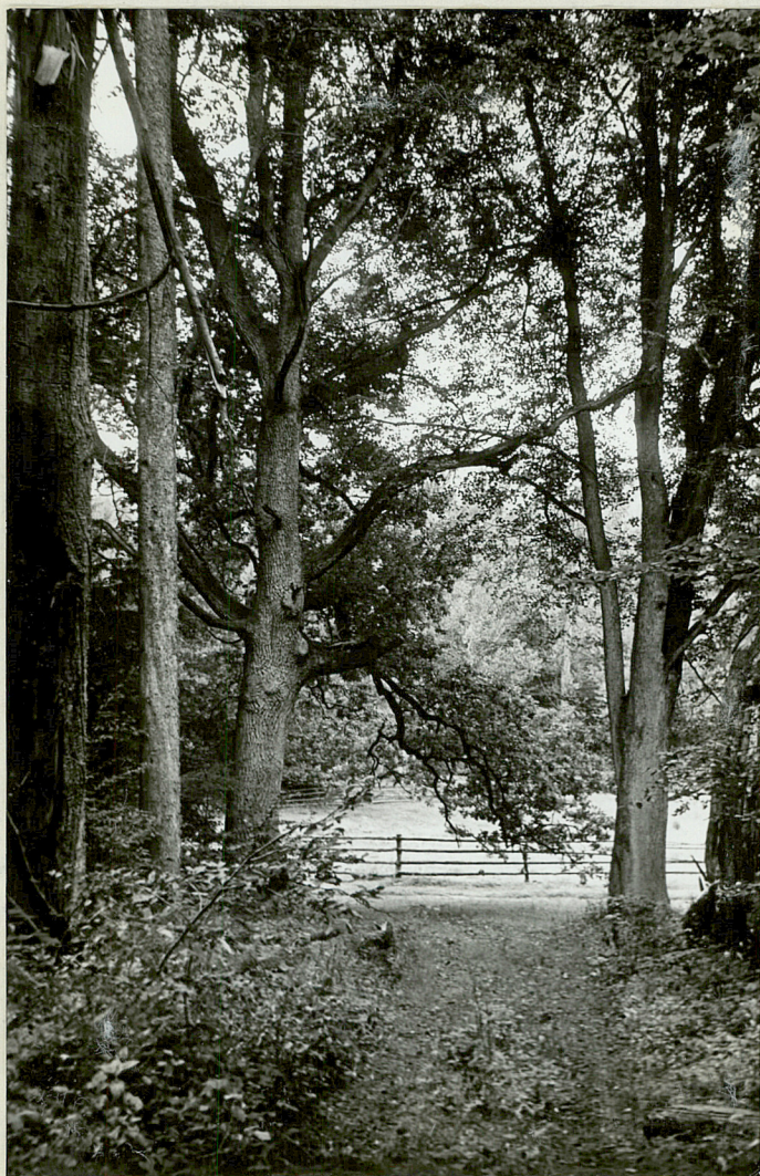
NR 5. WIELIN - Park