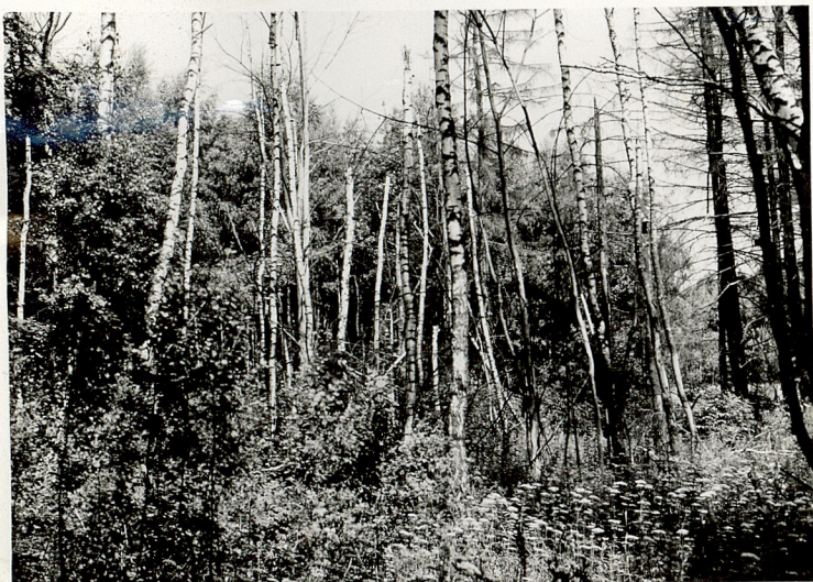
11. 2. Wnętrze - drzewostan