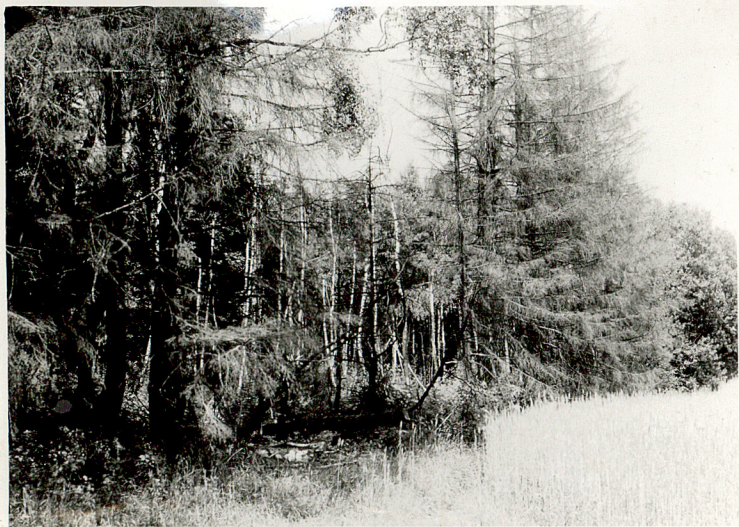
11. 1. Wnętrze - usychający drzewostan