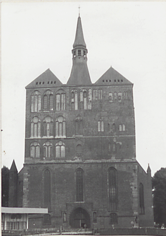
Kołobrzeg, cm. przykościelny 1. Szkielet ludzki w wykopie archeologicznym 2. Kościół - widok z zewnątrz od strony budowy domu parafialnego 3. Fasada kościoła