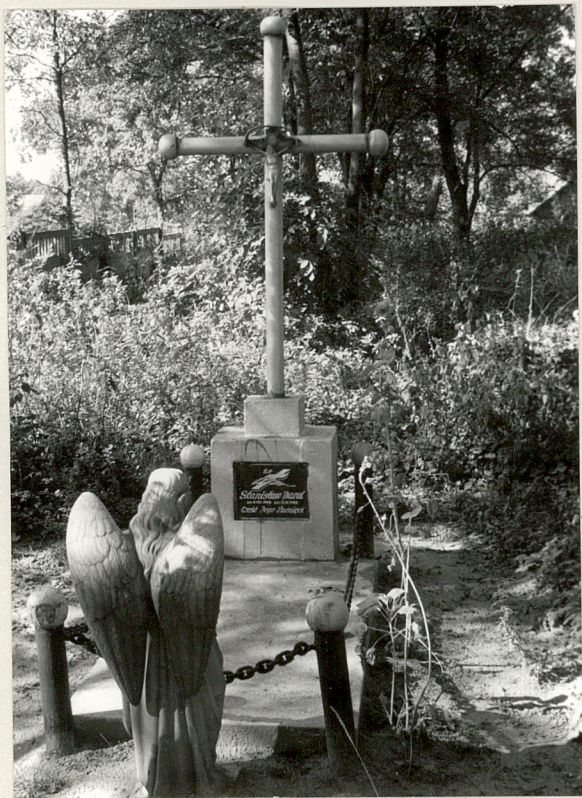
Ławy, cm. komunalny 1. Wnętrze 2. Nagrobek z 1942 r.