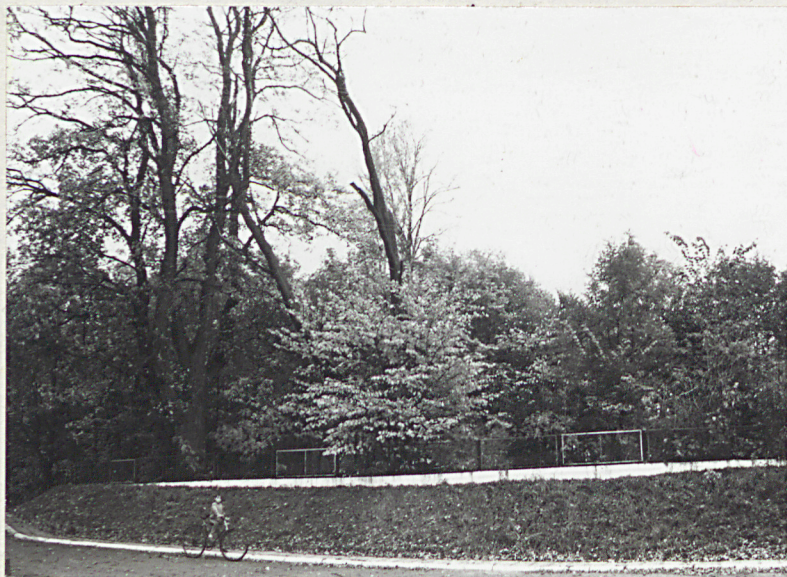
Przytoń, gm. Ostrowice; cm. przykościelny 1. Widok ogólny - zadrzewienie