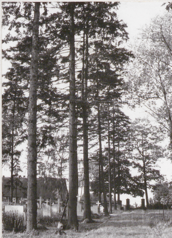
Sokoliniec, gm. Recz 1. Brama i mur cmentarny 2. Wnętrze, szpaler świerków wzdłuż alei głównej