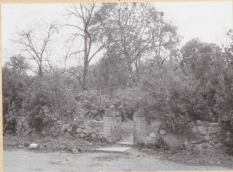
Wardyn, cm. przykościelny 1. Furtka i mur cmentarny