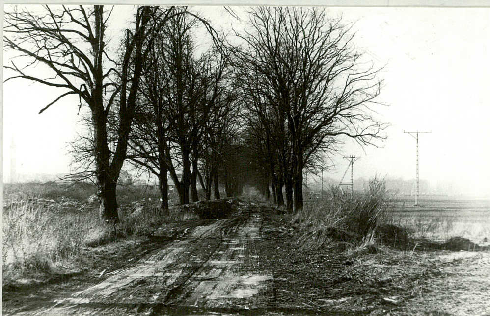
7. Wnętrze alei