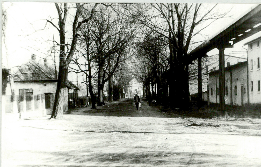
4. Aleja przy ul. Ostrobrzoga