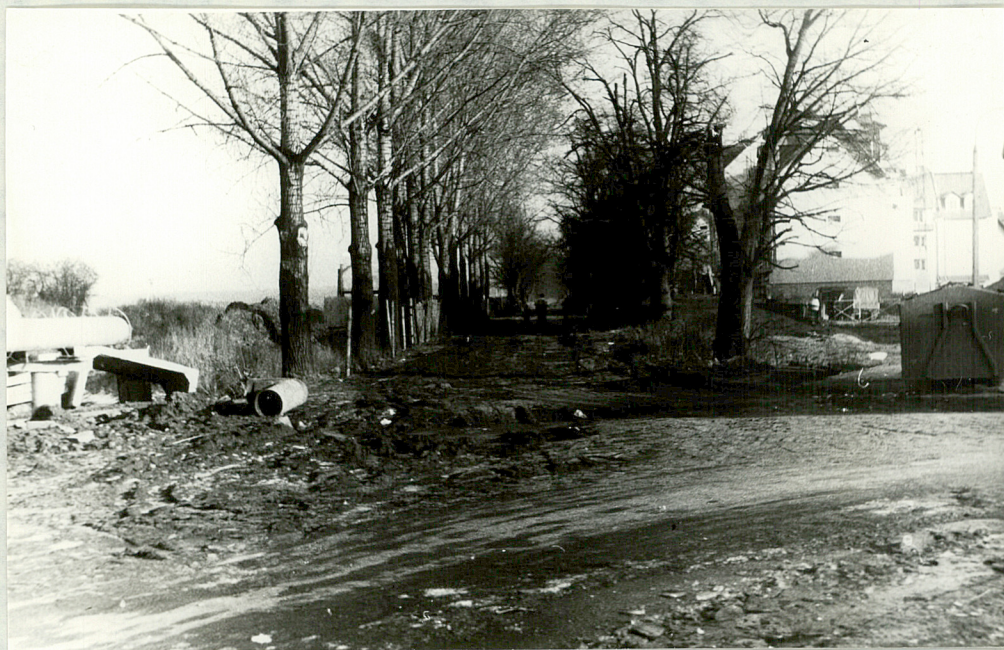
5. Widok na aleję od ulicy Studziennej w kierunku wschodnim