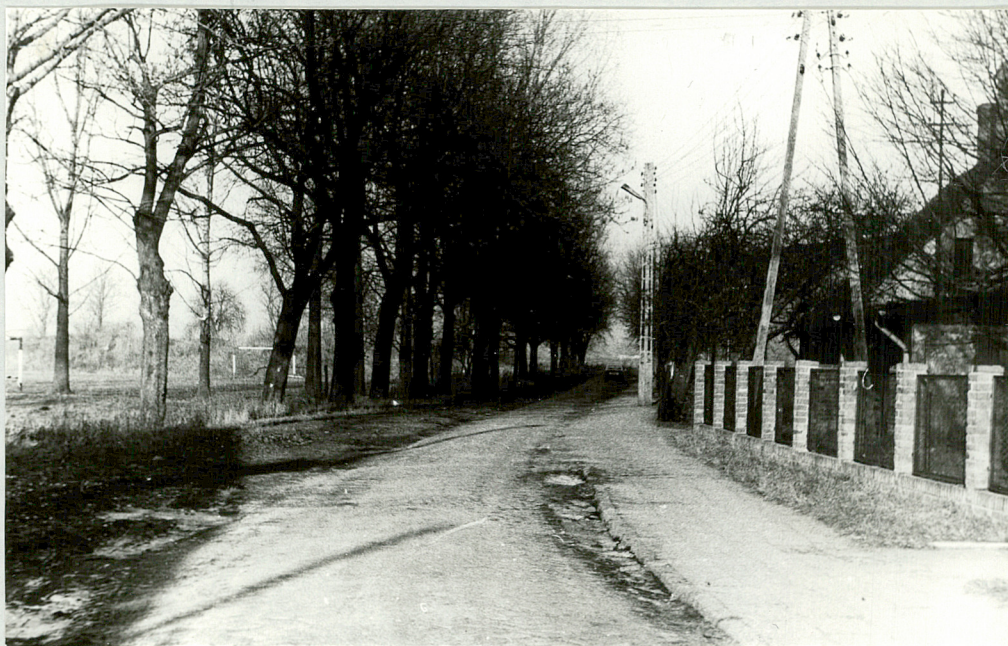
3. Aleja przy ul. Ostrobrzoga