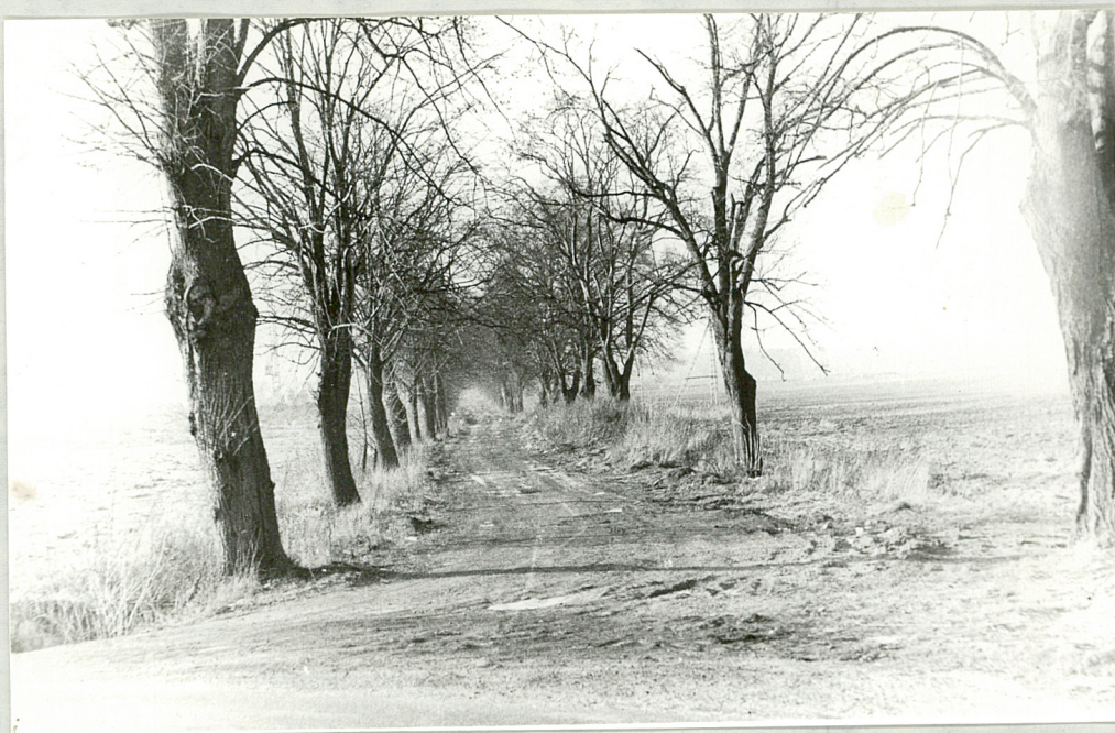
9. Wnętrze alei