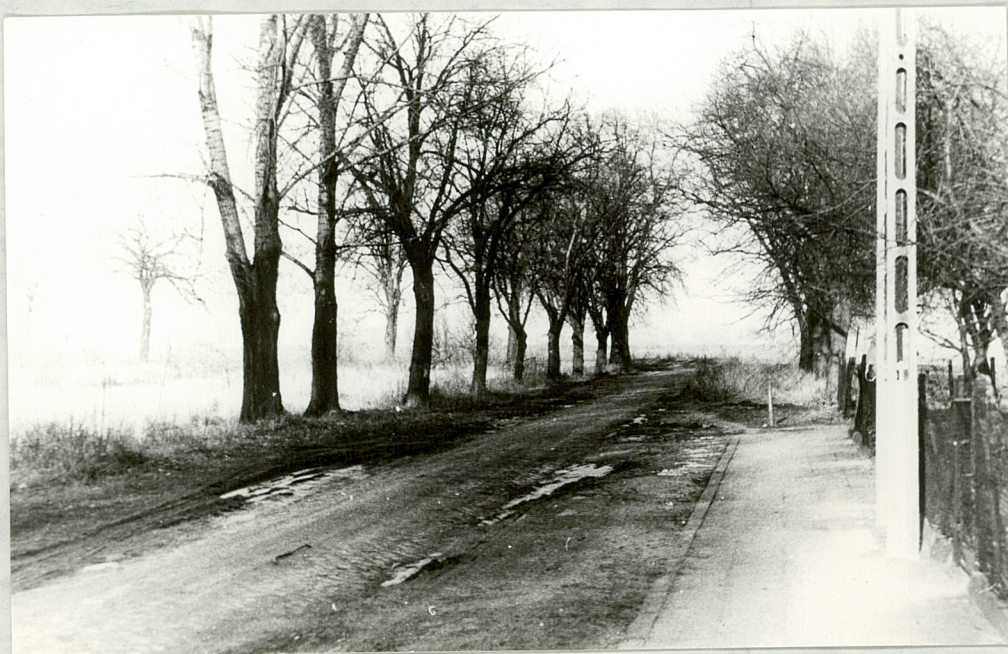
10. Aleja przy ul. Ostroroga