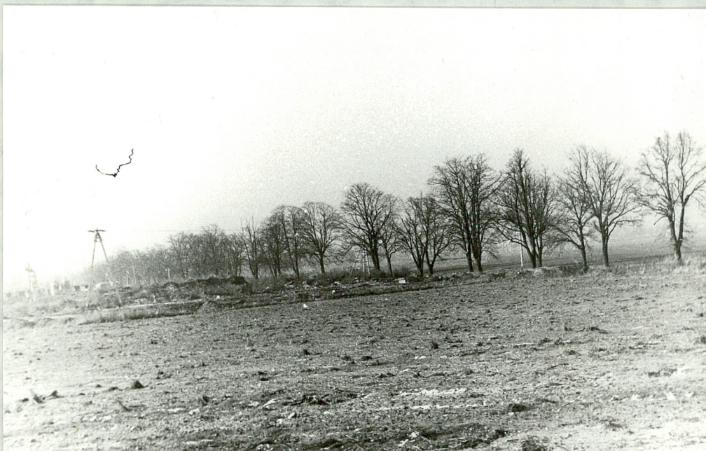
11. Perspektawa na aleję z ulicy Osieckiej