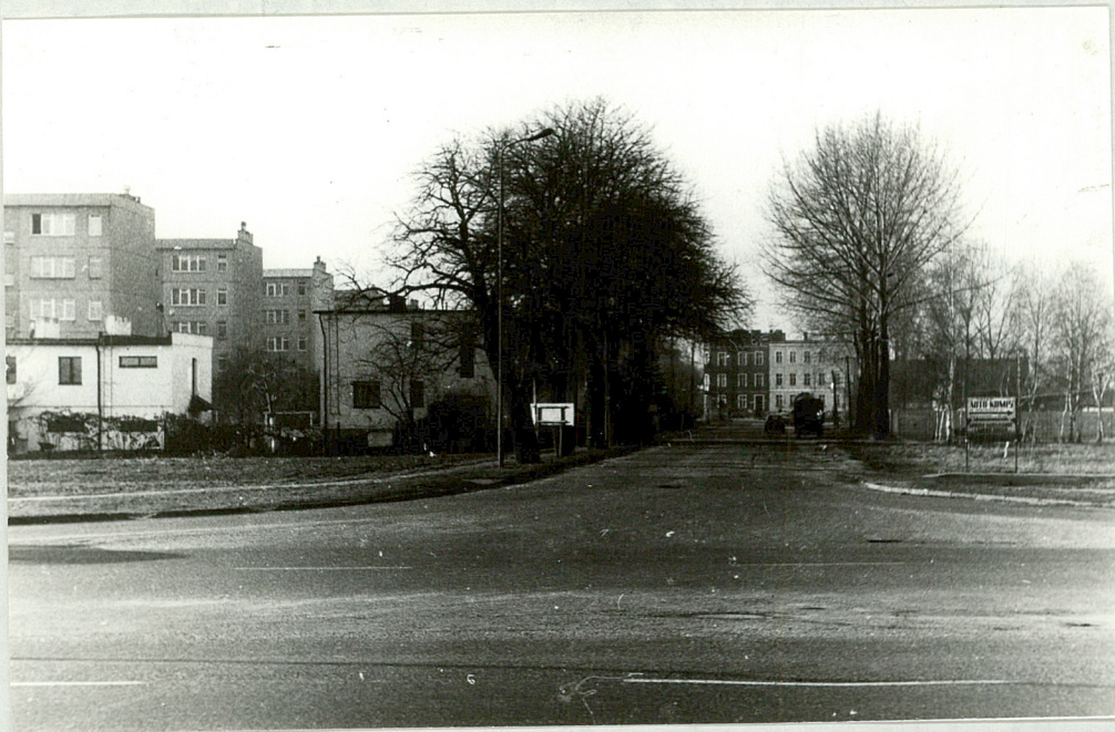
1! Szczątki aleji przy ul. Opalińskich