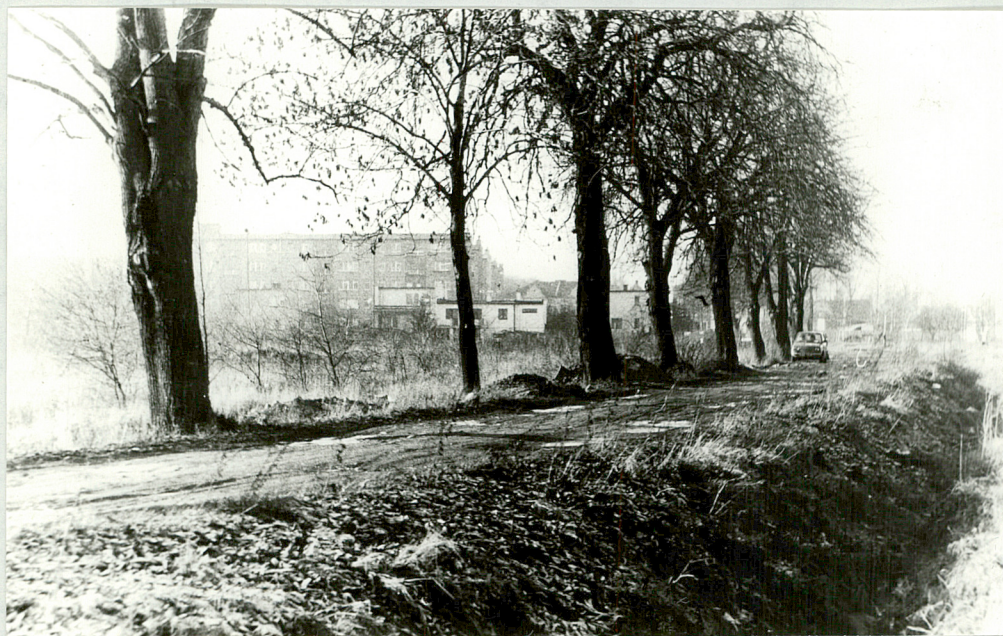
2! Aleja przy ul. Opalińskich od skrzyżowania z ul. Mickiewicza