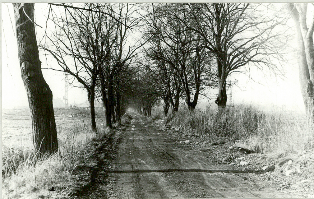
8. Wnętrze alei