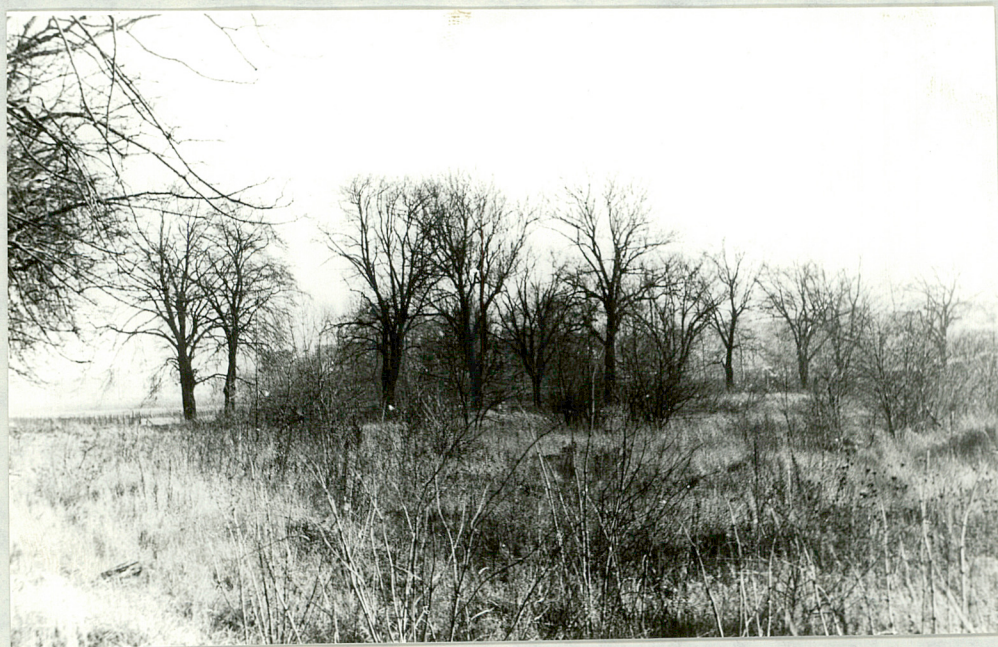
6. Widok na aleję od ul. Studziennej