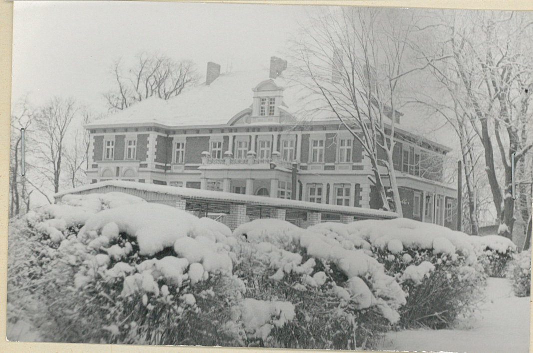
fot 3/ Widok pawilo- nu letniego na tle pałac