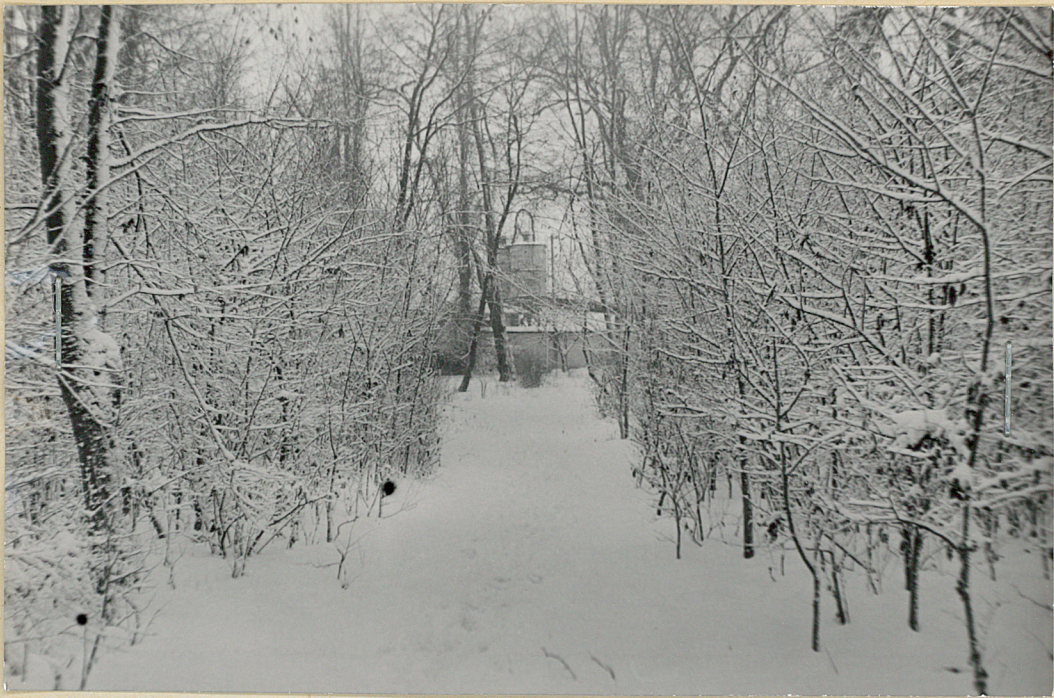
fot 10/ Drzewostan parkowy z odrostami grabu i klonu