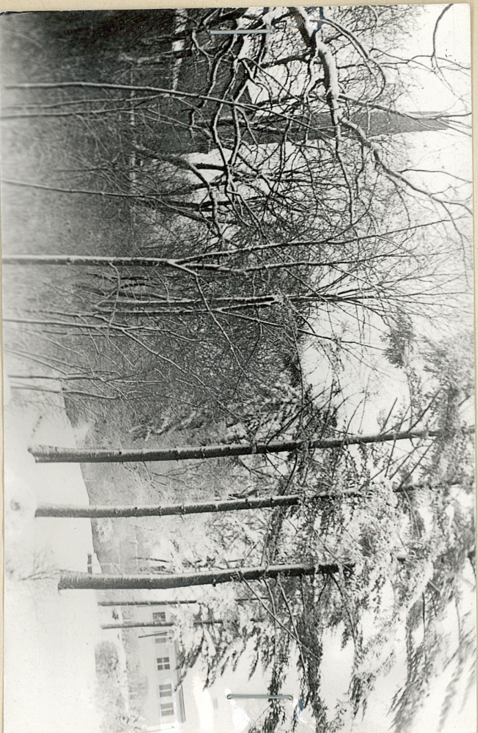
fot 5/ Gorzelnia źródło za- nieczyszcze- nia