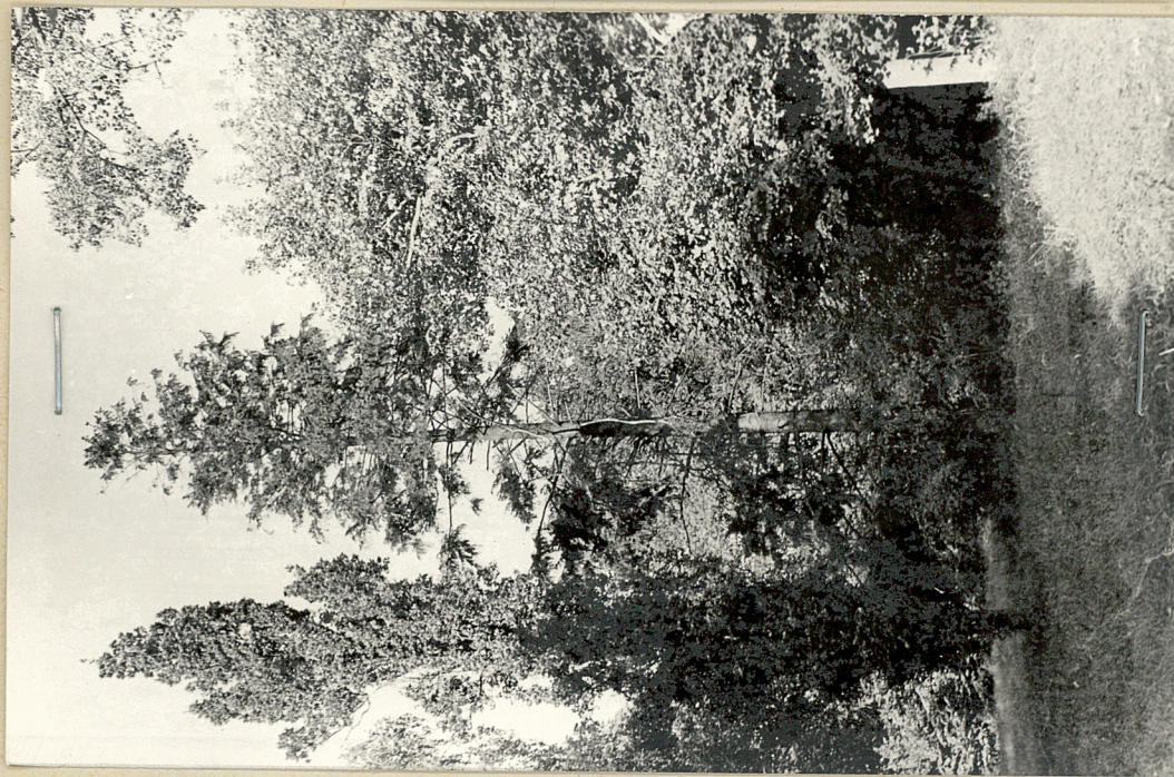
fot 11/ Fragment drzewostanu z dnem szy- pułkowym odmiany kolum- nowej