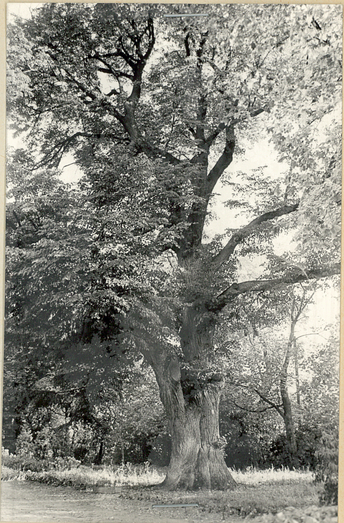
fot 4/ Pomnikowa lilpa