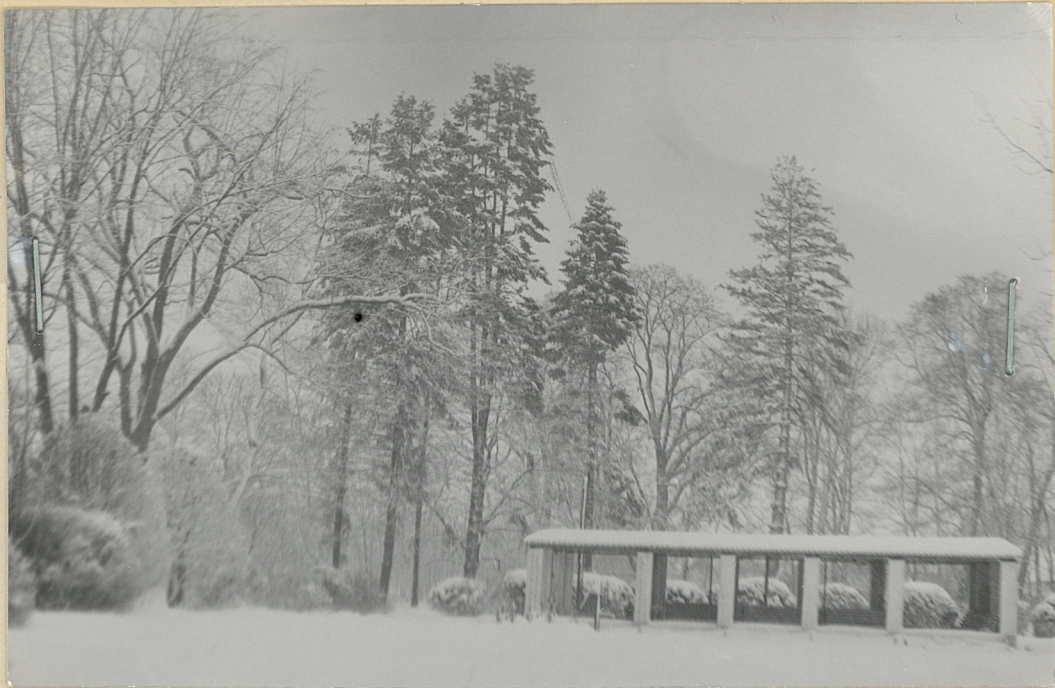
fot 7/ Widok pawilonu let- niego w tle drzewostan