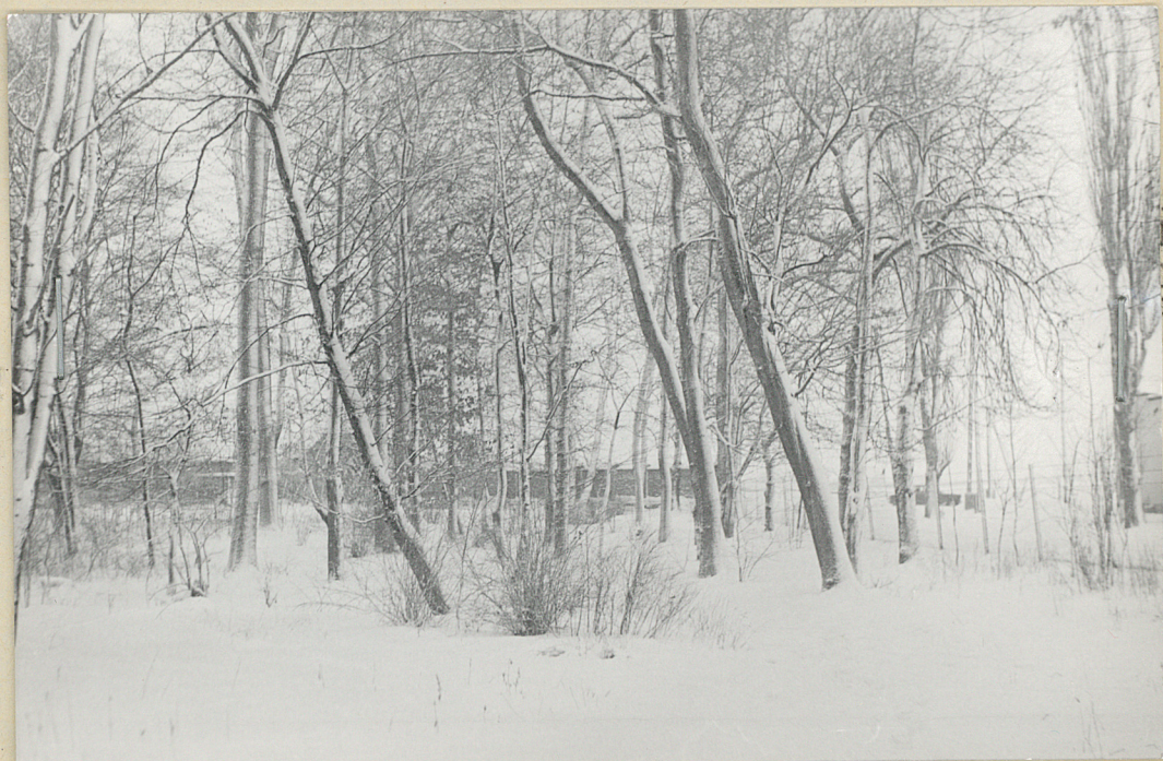
fot 8/ Drzewostan parkowy z murem i ogrodzeniem z siatki