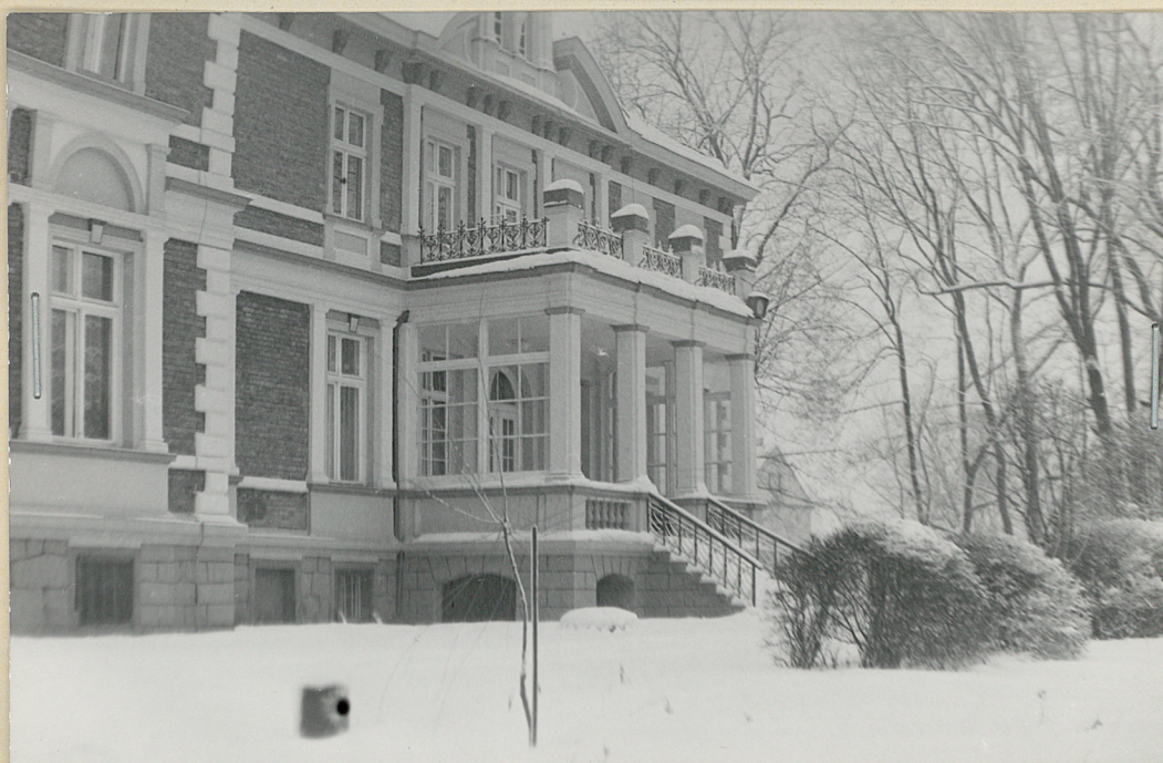
fot 2/ Pałac od stro- ny drzewosta- nu parkowego