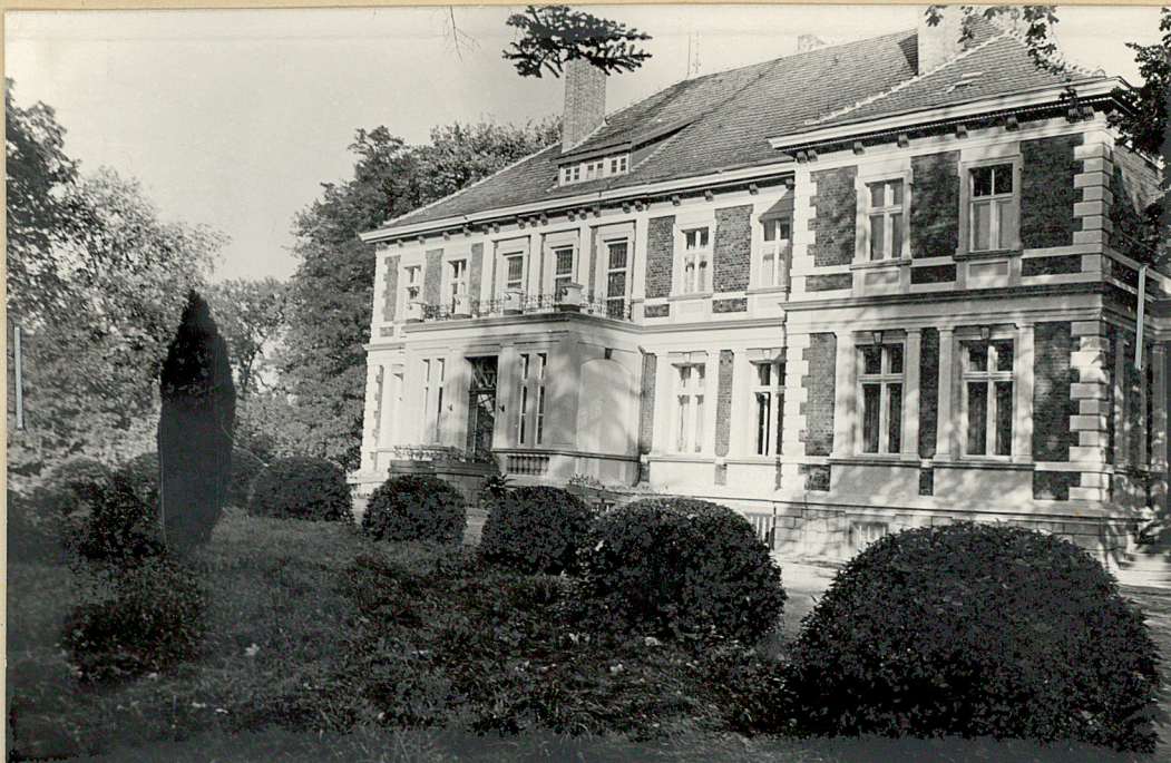
fot 1/ Elewacja za- chodnia parku