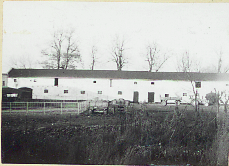
Fragment elewacji południowej /zachodnią część/