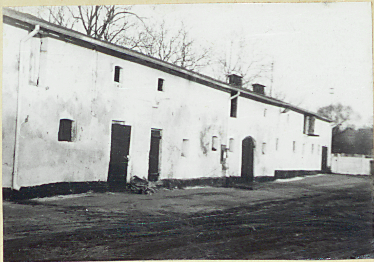
Fragment elewacji południowej /wschodnią część/