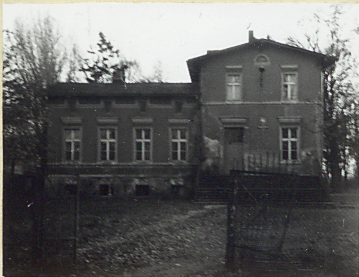
Dwór - elewacja północna frontowa