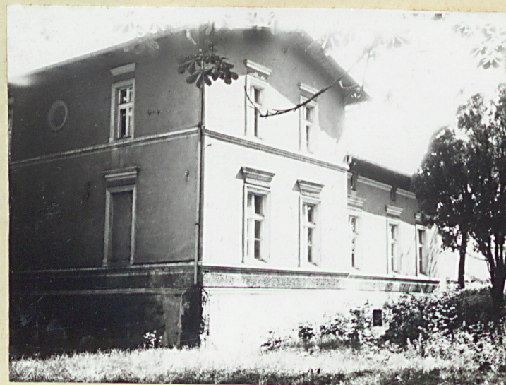
Dwór - elewacja południowa