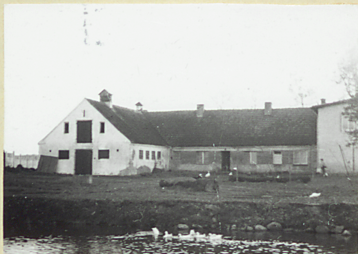
Widok na budynek mieszkalny/nr.3/ oraz owczarnię/nr.4/ od strony drogi.