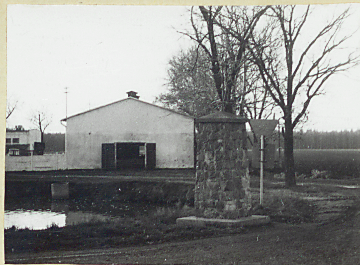
Cokół kamienny /przydrożny/