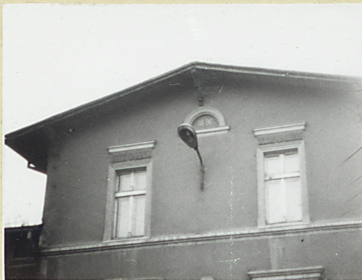
Dwór - fragment eleacji północnej /część podokapowa/