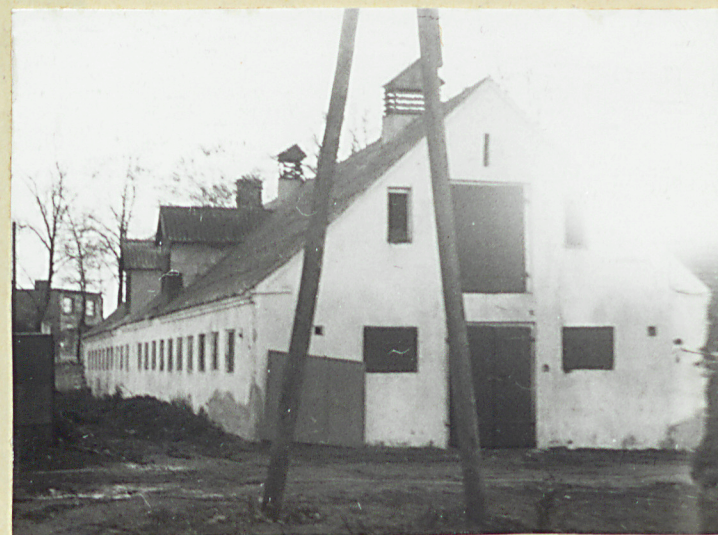
Owczarnia - elewacja północno-wschodnia