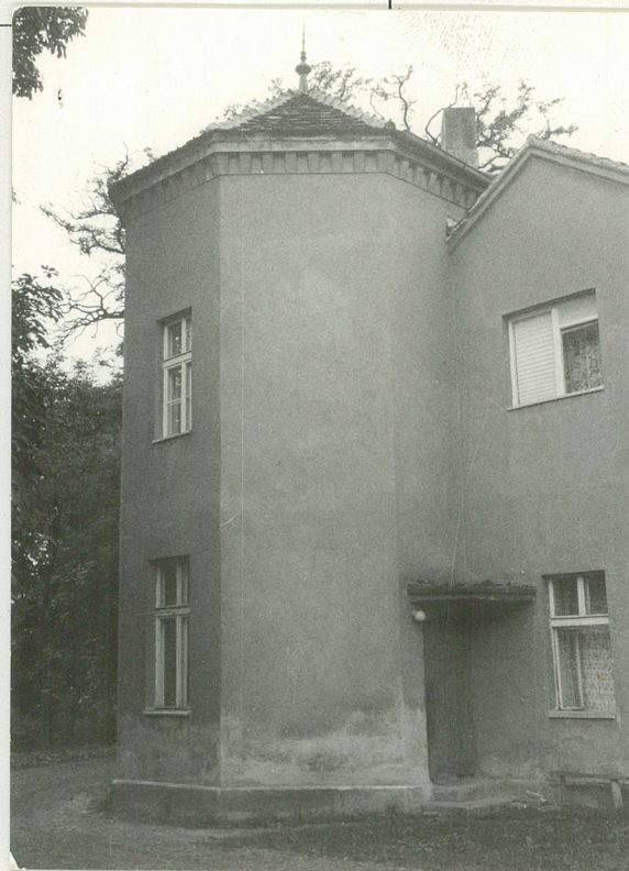
Widok na wieżę od wschodu.