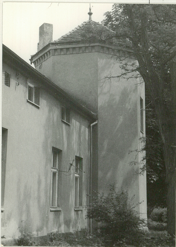
Widok na wieżę od zachodu.

3. Zawartość wkładki (nazwa obiektu lub materiału uzupełniającego)