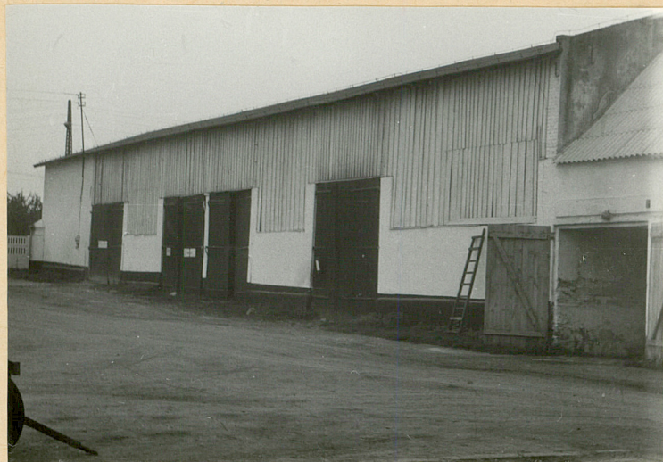
Stodoła /4/ - elewacja wschodnia