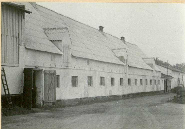
Obora-ob.magazyn paszowo-nawozowy /3/ Elewacja wschodnia

3. Zawartość wkładki (nazwa obiektu lub materiału uzupełniającego) zdjęcia