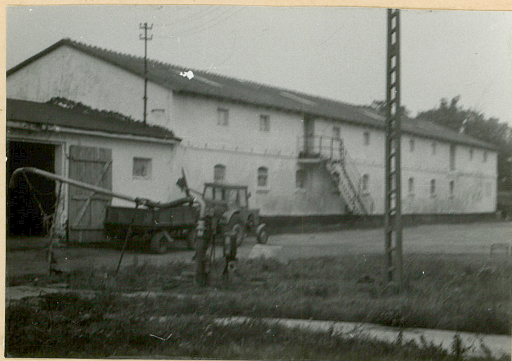
Obera-ob.magazyn nawozowo-paszowy /2/ Elewacja wschodnia