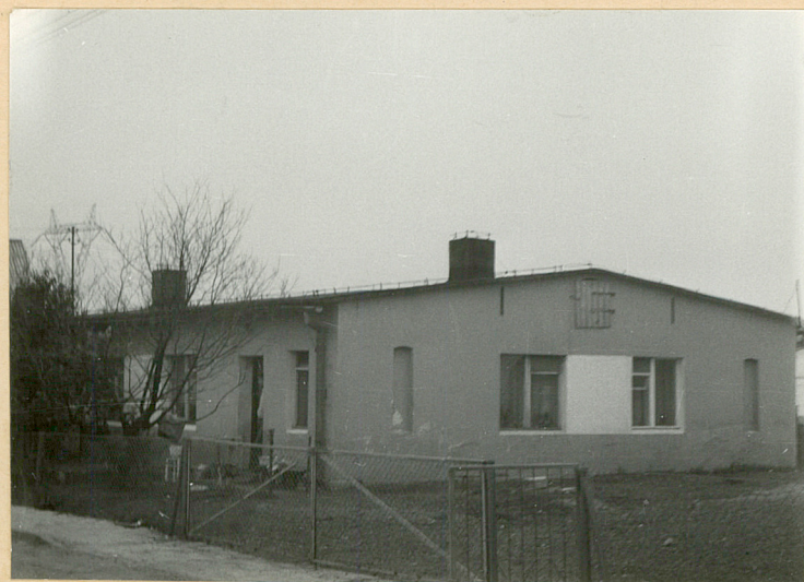
Budynek mieszkalny-czworak /23/ Elewacja płn.-wsch.