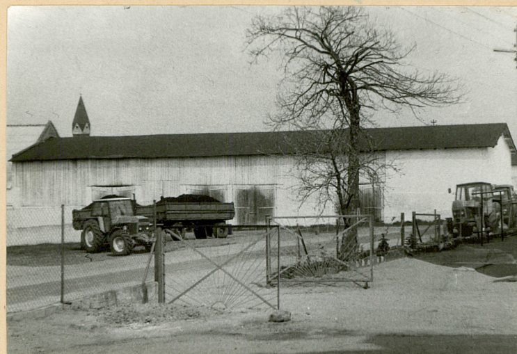
Stodoła /4/ - elewacja zachodnia