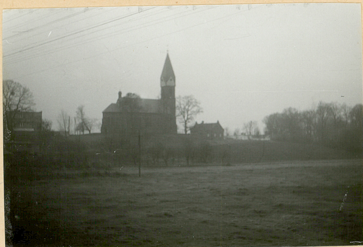
Kościół parafialny p.w. św. Filipa i Jakuba