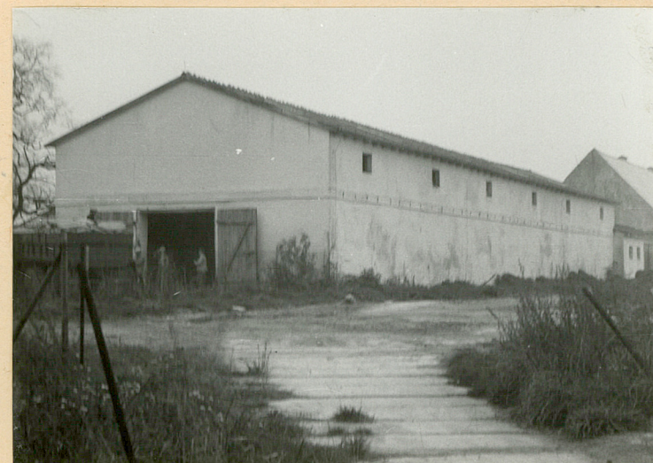
Obera-ob.magazyn nawozowo-paszowy /2/ Elewacja północno-zachodnia