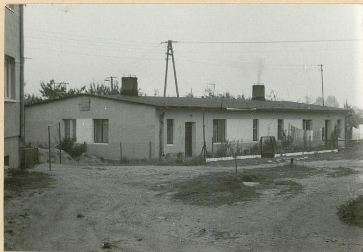
Budynek mieszkalny-czworak /21/ Elewacja płn.-zach.