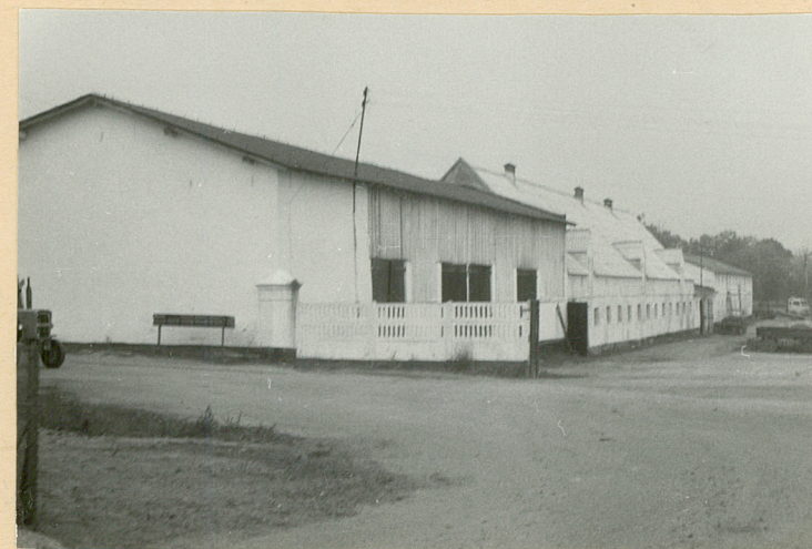
Główne wejście na teren podwórza gospod.