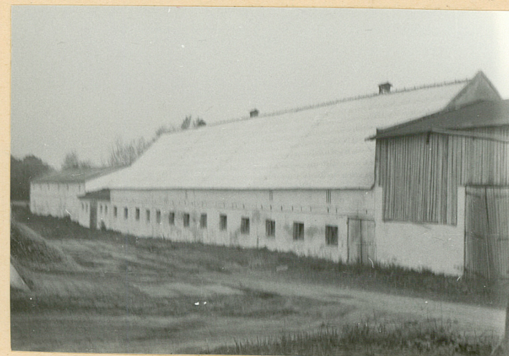
Obora /3/ - elewacja zachodnia