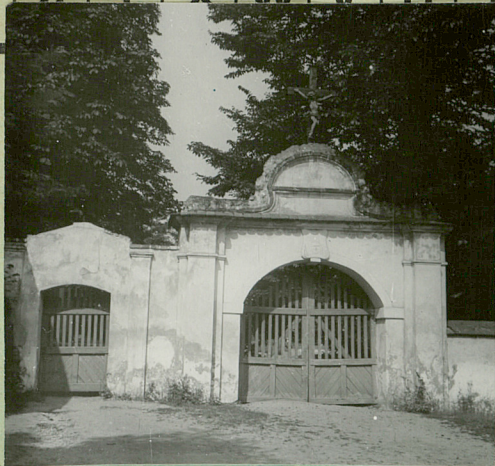
wagi opisowe, fotografia