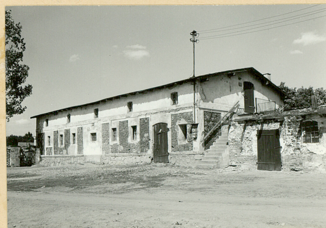
Elewacje zach. i pdn.