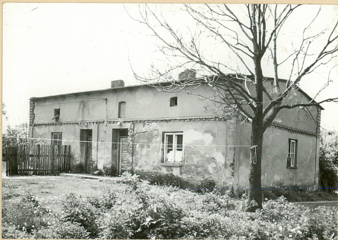
Elewacje pdn. i wsch.

11. Zdjęcia, rzut, przekrój, sytuacja, orientacja