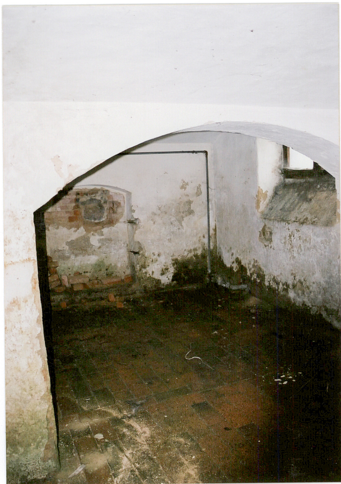
Piwnica - sklepienie, ceglana posadzka. budynku „A”.