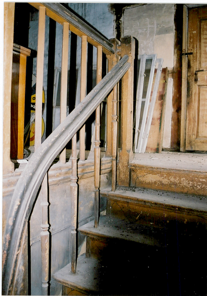
Klatka schodowa z drewnianą balustradą.