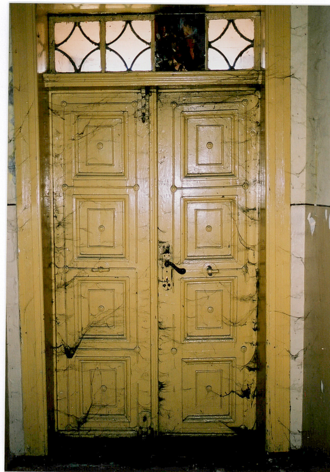
Stołarka drzwi wejściowych w elewacji wschodniej budynku „B”.