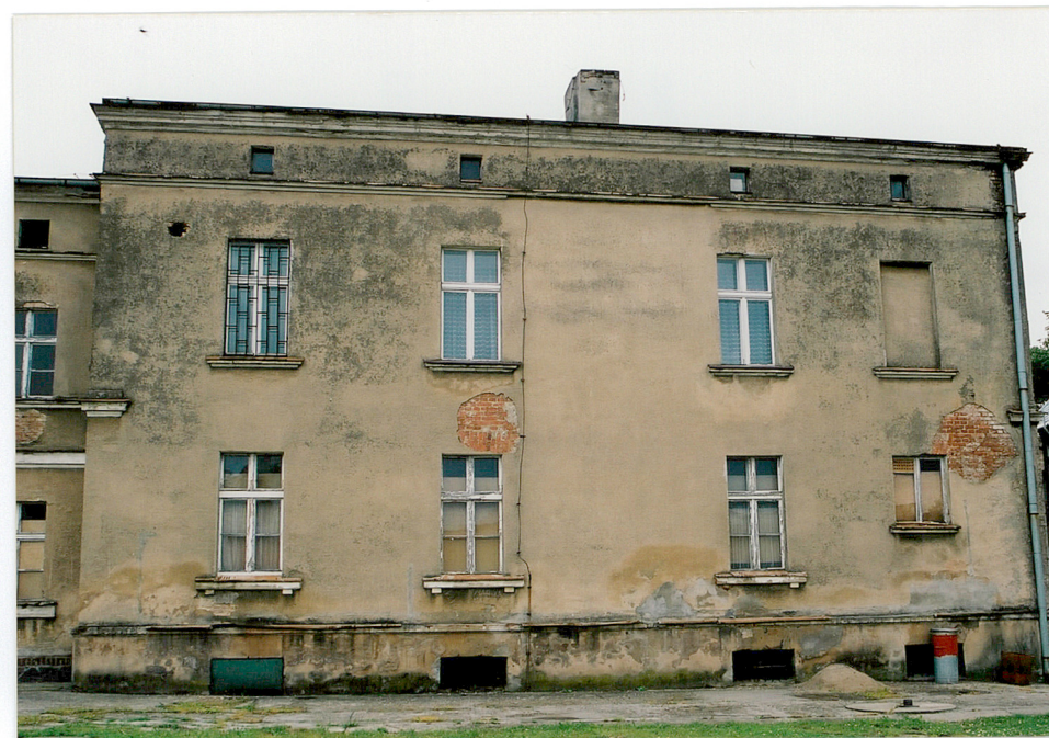
Elewacja zachodnia budynku „A”.