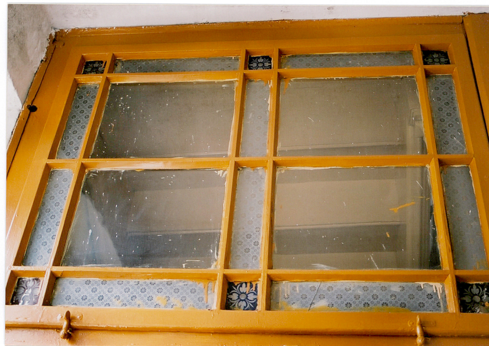
Stolarka drzwi (z nadświetlem) z klatki schodowej na drugą kondygnację. budynku „A”.