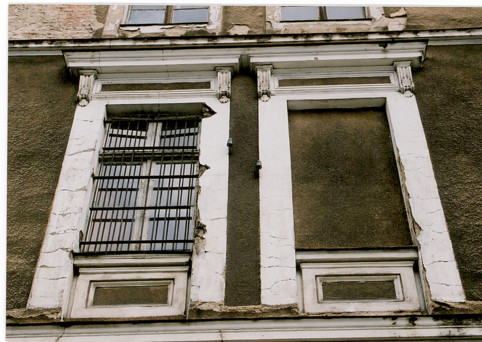
Elewacja południowa budynku „A”.