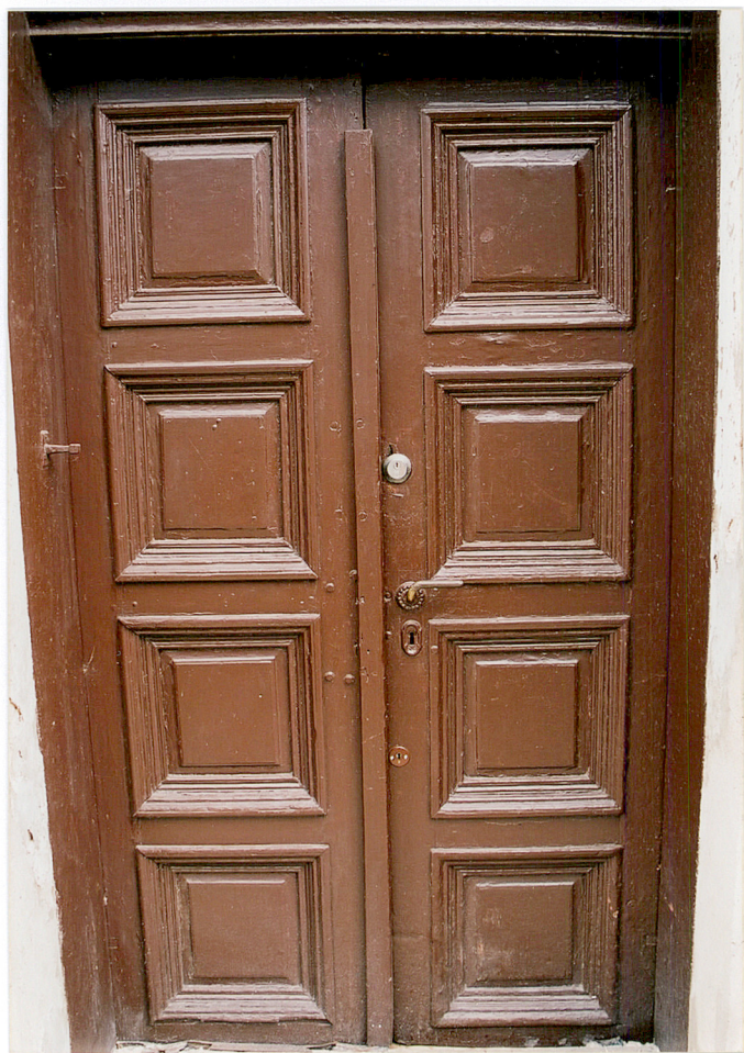
Stolarka drzwi wejściowych w elewacji południowej (szczytowej) budynku „A”.