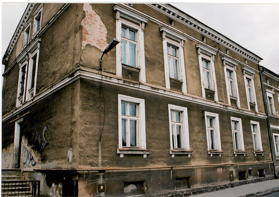
Elewacja wschodnia budynku „A”.