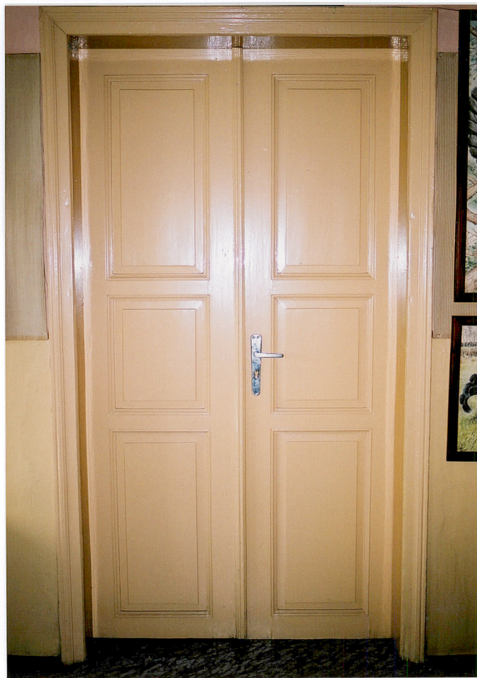
Stolarka wewnętrzna drzwi, budynku „A”.