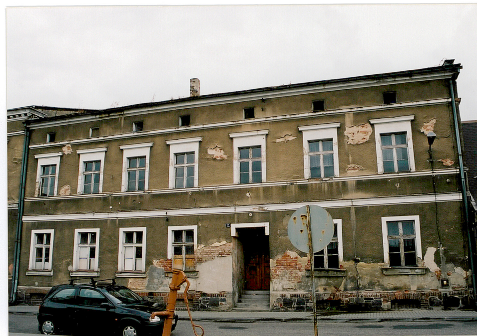
Elewacja wschodnia budynku „B”.