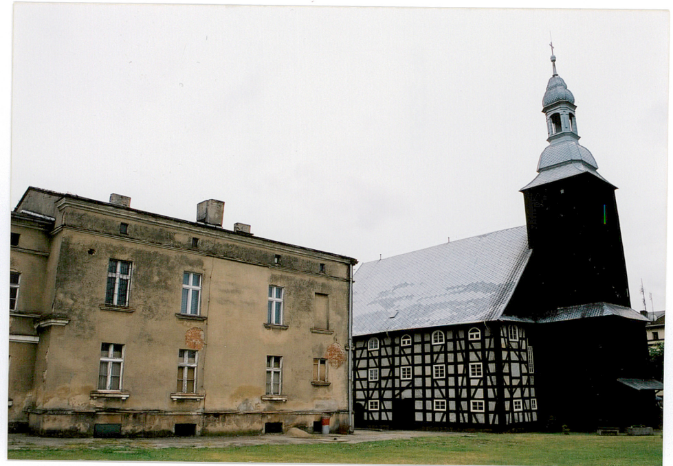
Widok na budynek szkoły od strony dziedzińca, po prawej kościół ewangelicki, po lewej garaże dla zabytkowych pojazdów strażackich.