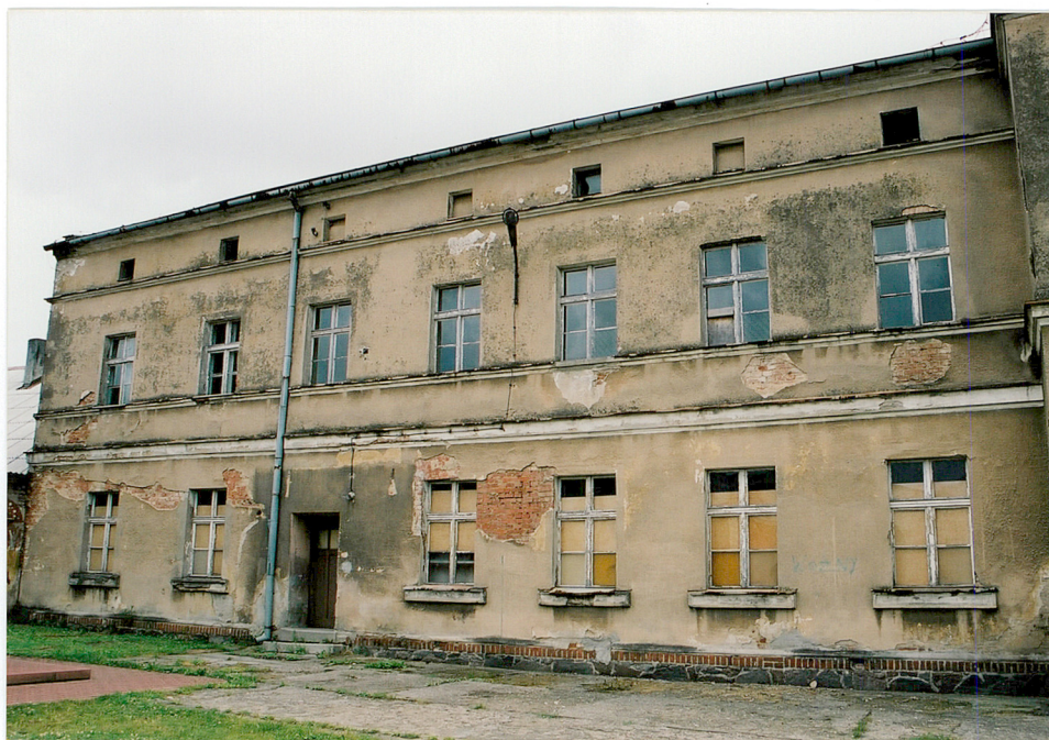
Elewacja zachodnia budynku „B”.