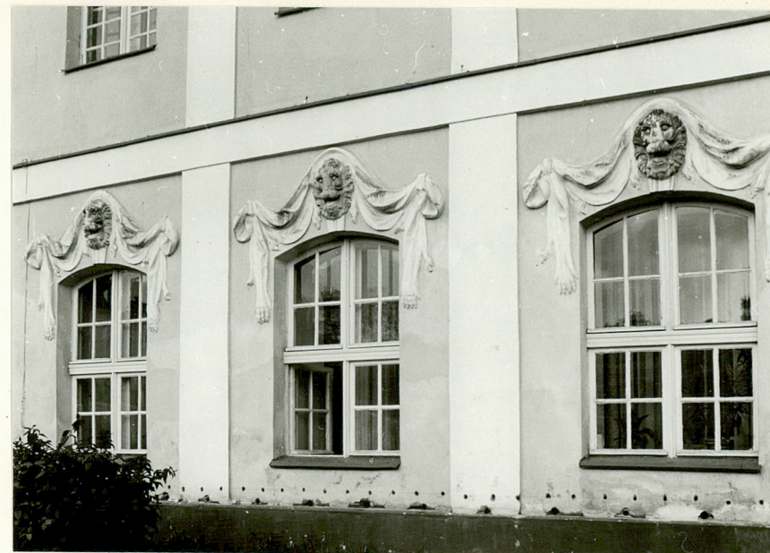
6. fragment fasady - dekoracja ryzalitu /parter/