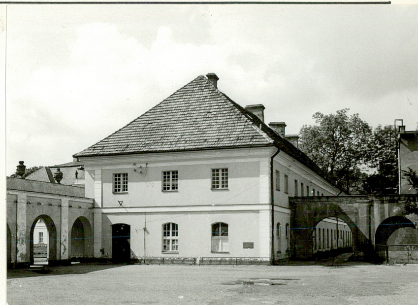
3. elewacja pn.-wsch.