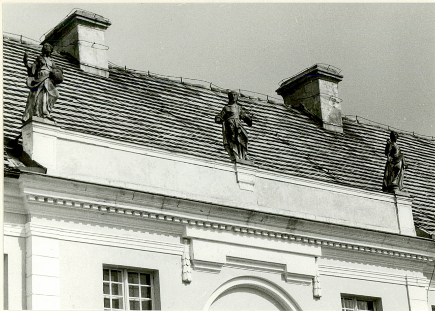
5. fragment fasady - attyka z figurami kobiecymi

3. Zawartość wkładki ( nazwa obiektu lub materiału uzupełniającego ) zdjęcia dodatkowe