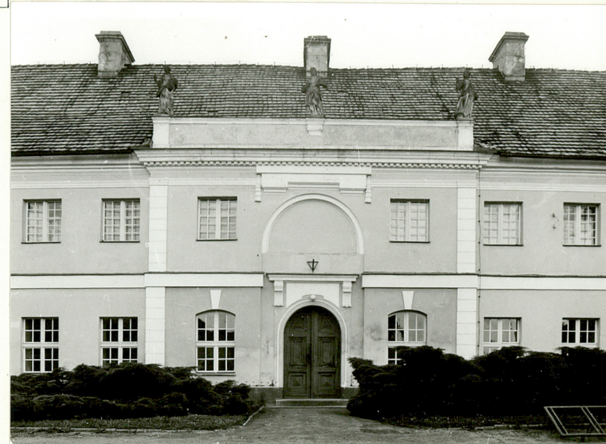
4. fragment fasady