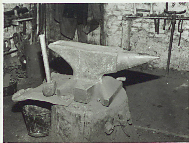
7. Narzędzia - wnętrze kuźni 8. Kowadło - wnętrze kuźni