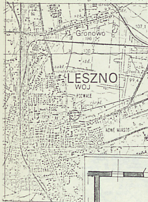
Plan orientacyjny 1:50000

11. Zdjęcia, rzut, przekrój, sytuacja, orientacja